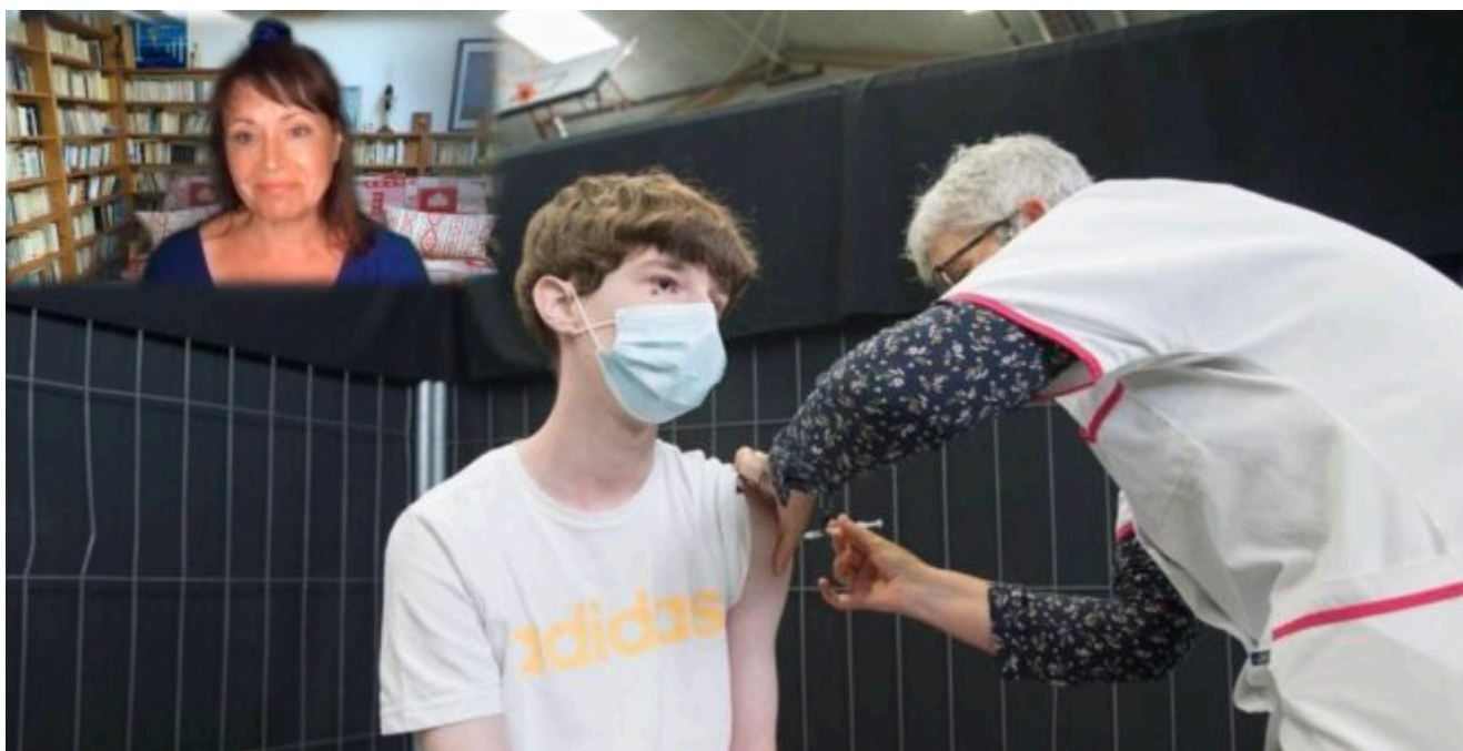
Un adolescent de 15 ans se fait vacciner au centre de vaccination à Douarnenez.

En Grande Bretagne, la vaccination des 12-15 ans est déconseillée Ont résisté aux pressions.