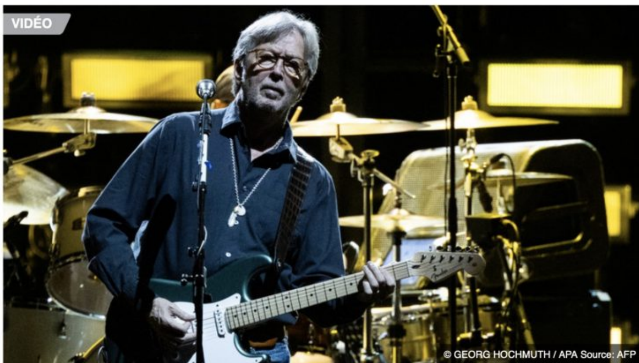
Le guitariste anglais Eric Clapton lors d'un concert à Vienne, en Autriche, le 6 juin 2019 (image d'illustration).