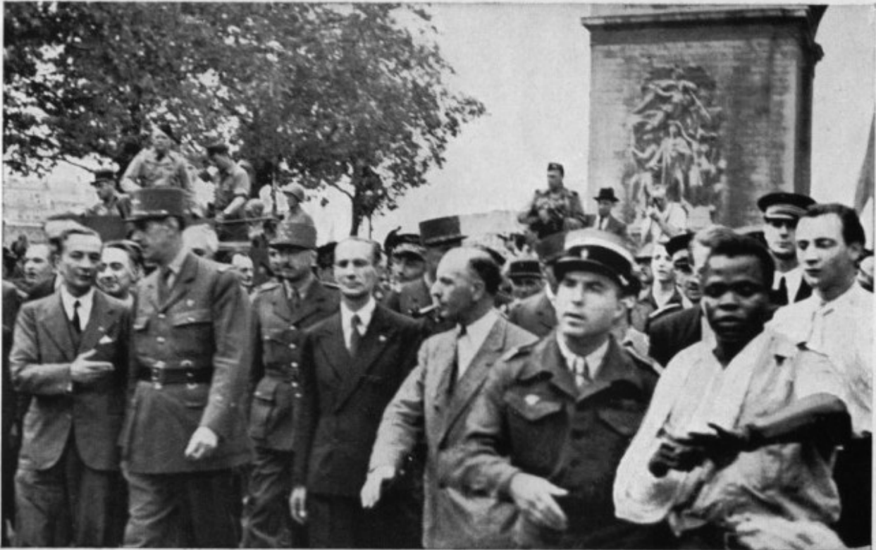
Le général de Gaulle descendant les Champs-Élysées A droite, le nègre Dukson