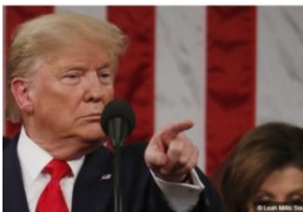
up le 4 février 2020 à Washington D.C.

La journaliste du New York Post, Miranda Devine , a demandé dimanche à Donald Trump quel était le plan de son administration pour sortir d’Afghanistan – qui a finalement été entravé par les mêmes généraux américains qui ont donné le feu vert à Biden.