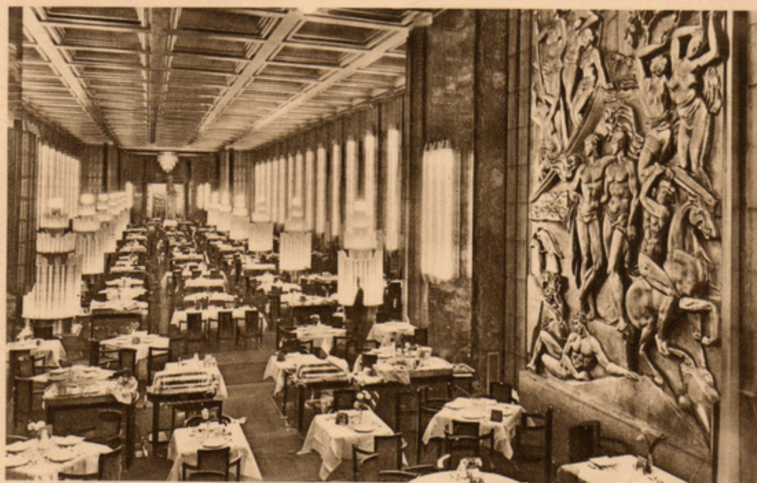
17. Le Paquebot "NORMANDIE" de la Cie Générale Transatlantique. — La grande salle à manger