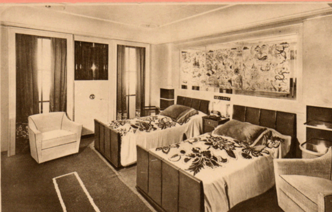
15. Le Paquebot "NORMANDIE" de la Cie Générale Transatlantique Fécamp Chambre à coucher de grand luxe

Après la guerre, Dinky Toys a poursuivi quelques temps encore la production du Queen Mary, pour Normandie, je l'ignore ? Et