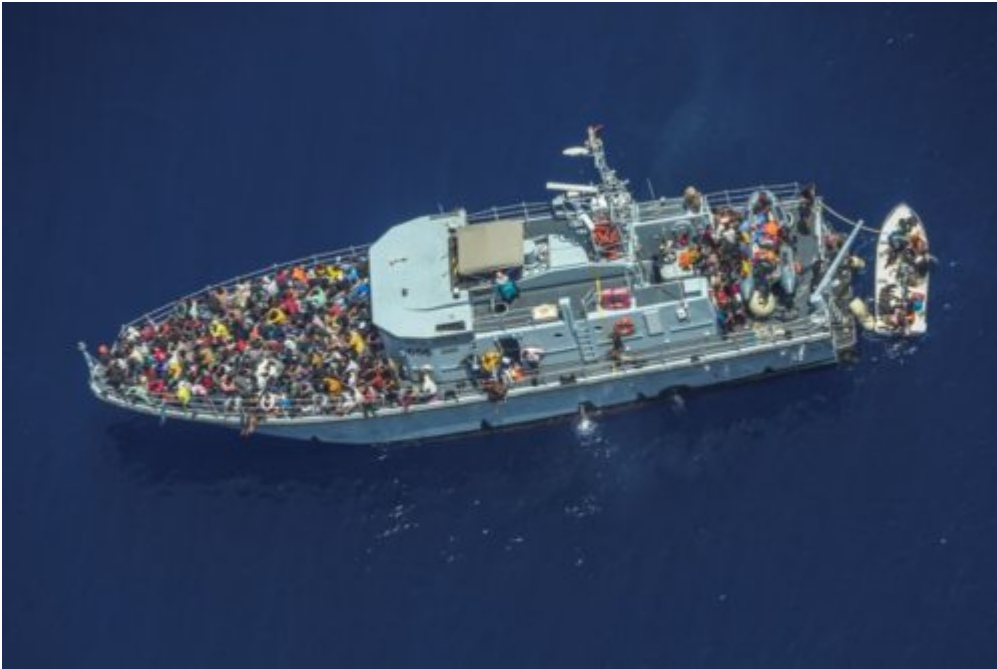
Photo : certains ont la chance d'être secourus par... les garde-côtes libyens !