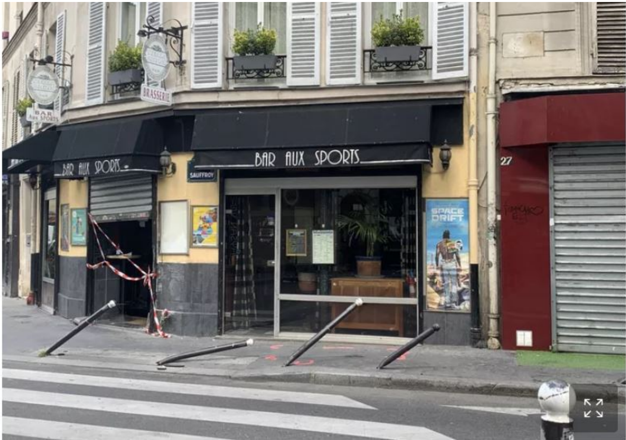
Des plots en métal servant à délimiter le trottoir ont également été renversés, preuve de la violence du choc. Nicolas Daquin

Le conducteur du véhicule, un homme de 23 ans bien connu des services de police, se trouve en urgence absolue. Le passager, lui, s'est enfui à pieds.