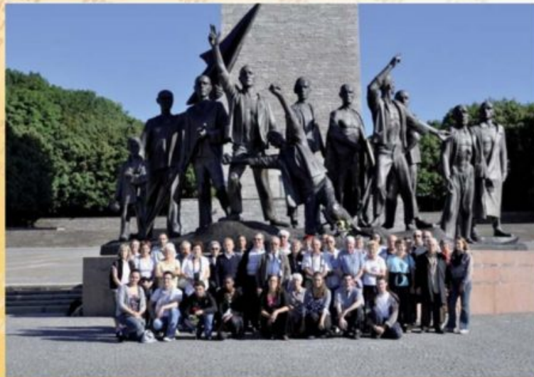
Les participants au voyage du 17 au 21 août 2010, devant le monument à Buchenwald

Texte d'un rapport de "visiteurs" du camp (p.8 à 10)