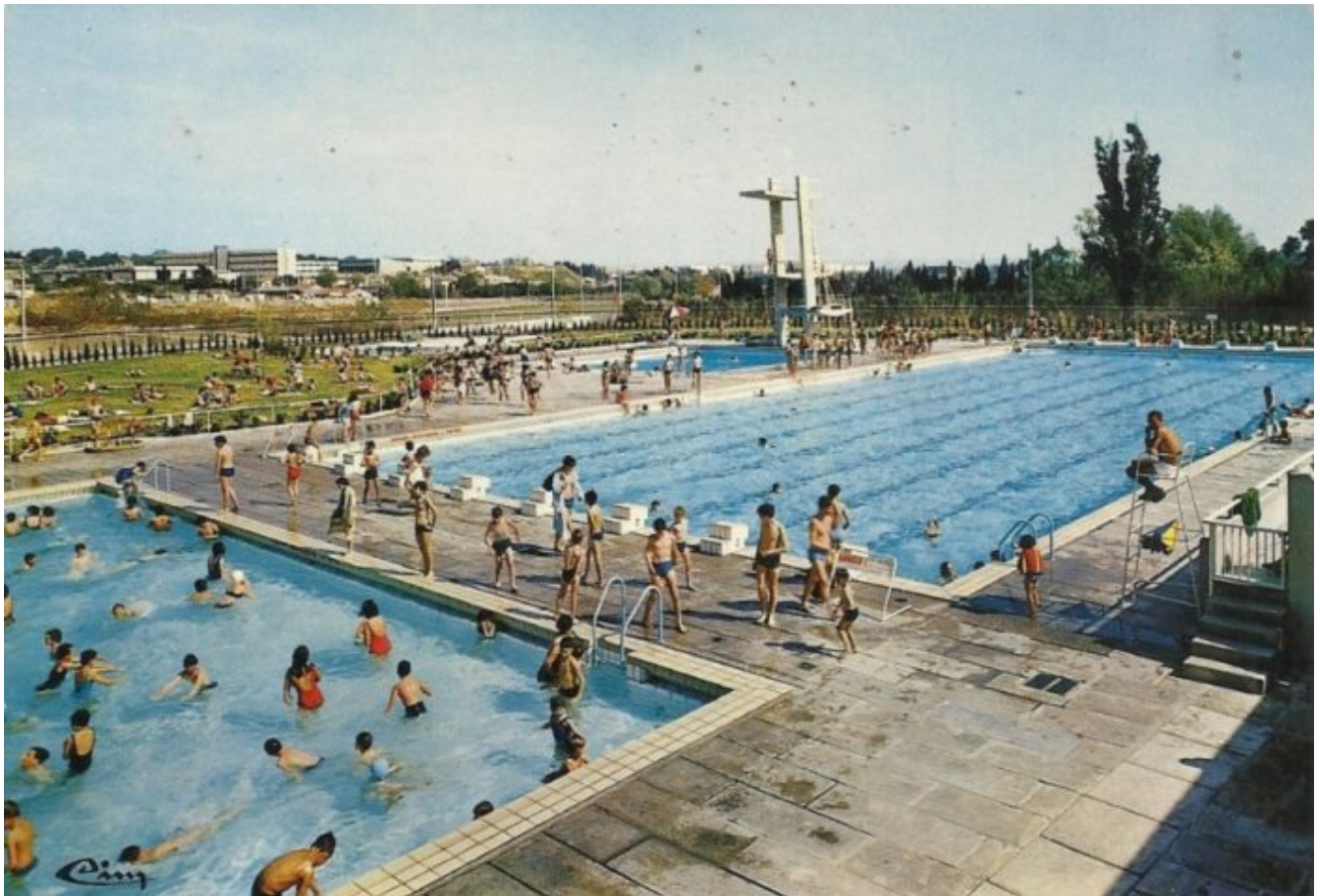
Salon-de-Provence. La piscine, ses bassins, architecte Scialon. La vie est encore préservée.