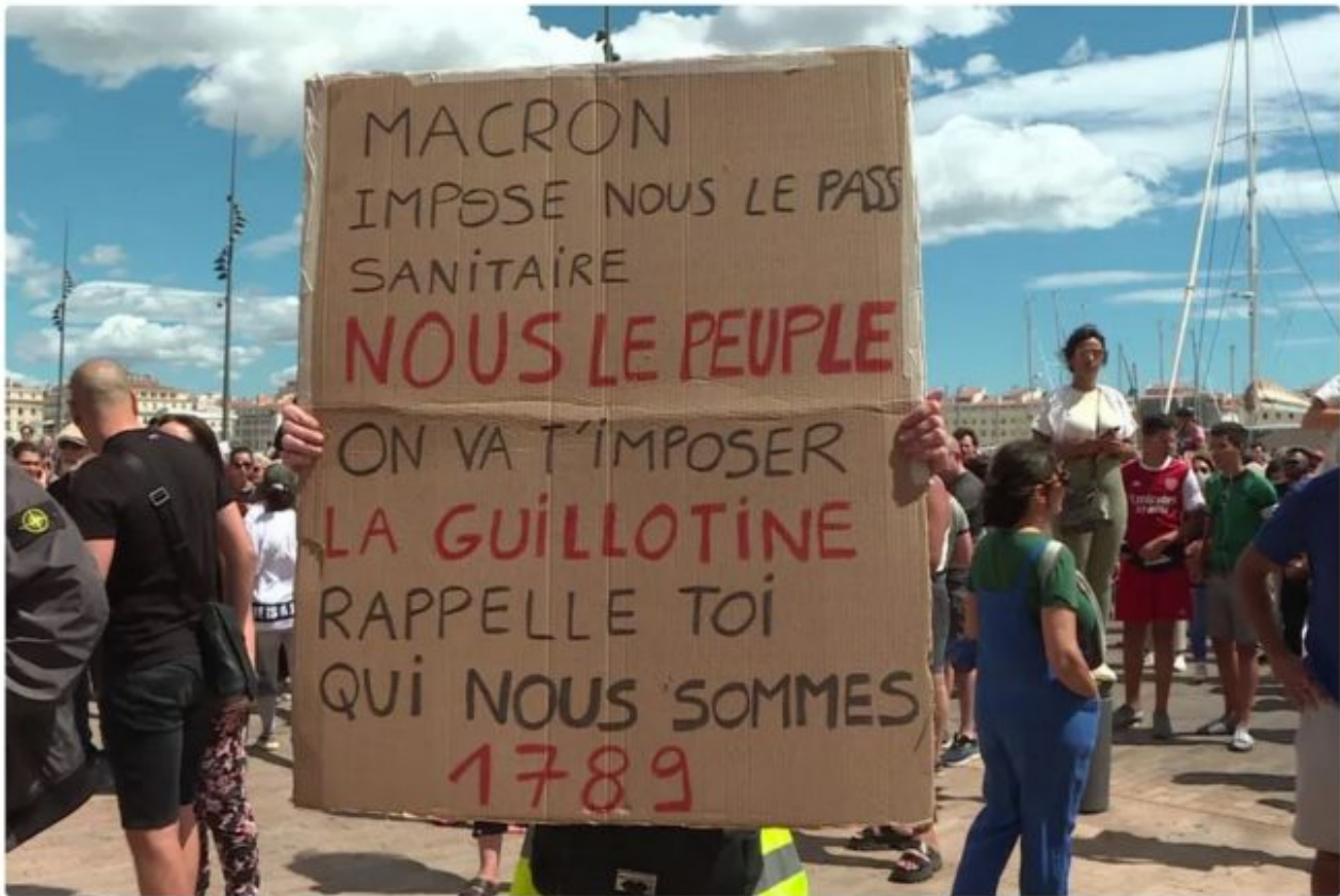
Pancarte tenue par un gilet jaune, lors de la manifestation contre le pass sanitaire.

Depuis le 14 juillet, les manifestations contre le passe sanitaire se multiplient. Il paraît selon Véran que « seule une ultra-minorité s'oppose à la vaccination »