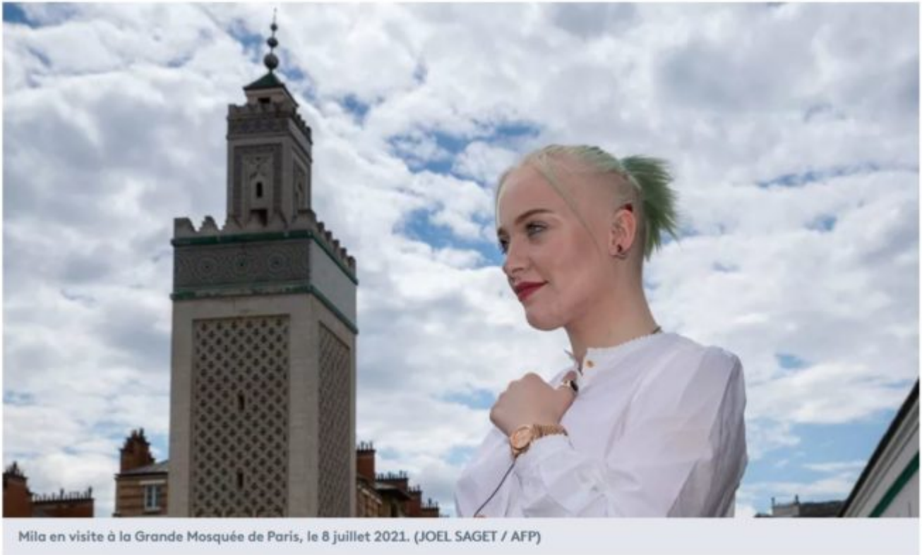
Mila en visite à la Grande Mosquée de Paris, le 8 juillet 2021.

Énième rebondissement dans l'affaire Mila : après la condamnation plutôt clémentine de 11 harceleurs (dont seulement 2 musulmans... sur 100 000 messages haineux et menaces de mort !) à 4-6 mois de prison avec sursis, voici maintenant Mila visitant la Grande mosquée de Paris pour espérer « l'apaisement ».