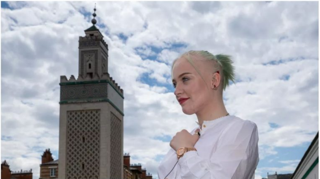
Mila en visite à la Grande Mosquée de Paris, le 8 juillet 2021.

written by François des Groux | 9 juillet 2021