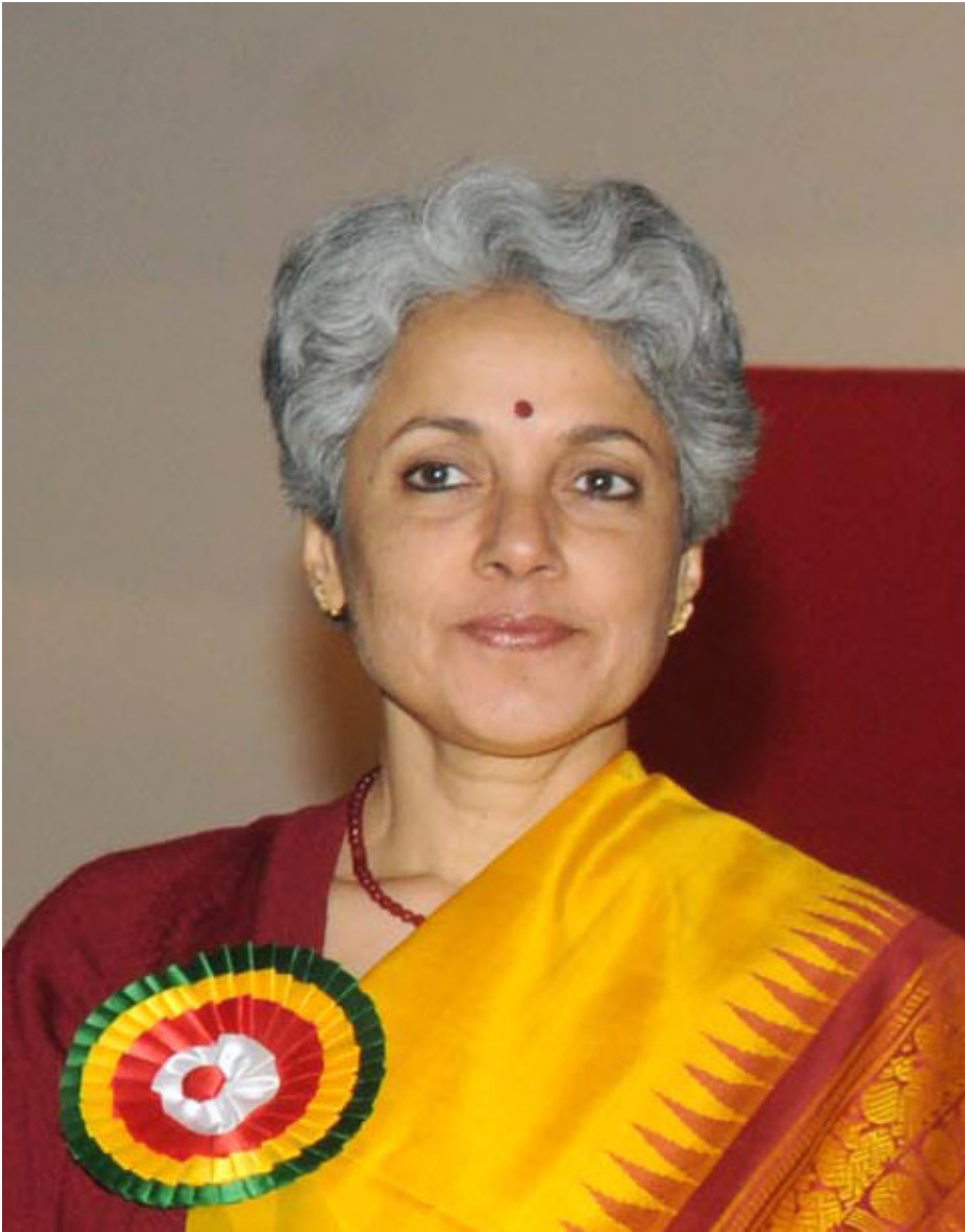
Dr Soumya Swaminathan