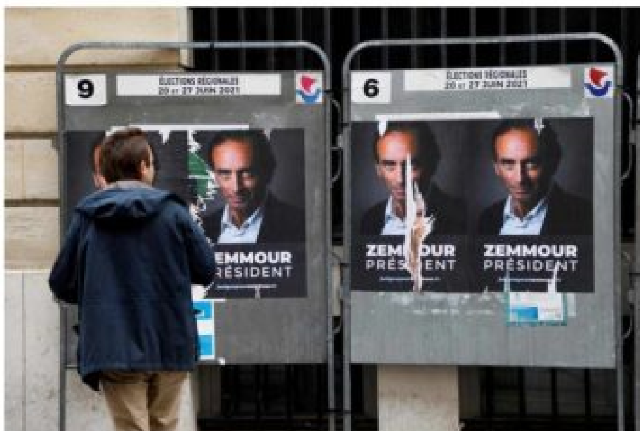
Des affiches « Zemmour président » placardées à Paris, le 28 juin 2021.

Ils ne sont pas peu fiers de leur coup. À l'aube lundi matin, à l'heure où la masse des abstentionnistes partait travailler et que les politiques se réveillaient avec la gueule de bois, cuvant leur défaite pour les uns, les autres vaguement honteux d'avoir été mal réélus, tous ont pu tomber sur de grandes affiches couvrant les panneaux électoraux encore en place : Zemmour président !