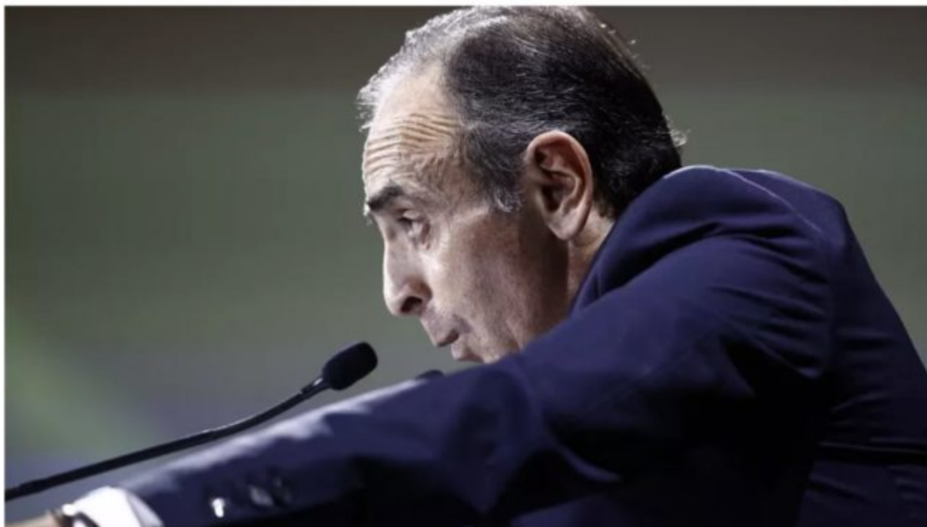
Éric Zemmour, le 29 septembre 2019.

Présidentielle : la candidature d'Éric Zemmour se précise, « l'échec du RN lui a donné des ailes »