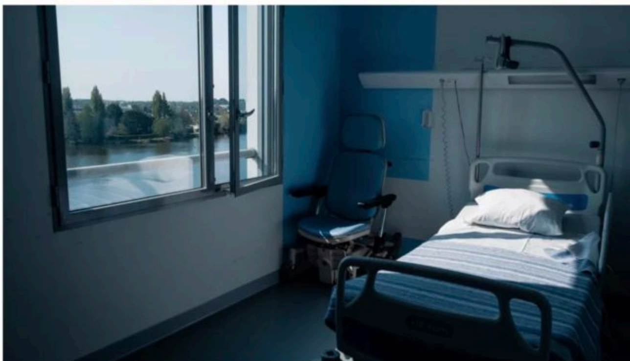
Un lit d'hôpital vide au Centre hospitalier Bretagne-Atlantique, à Vannes (Morbihan), le 21 avril 2021.