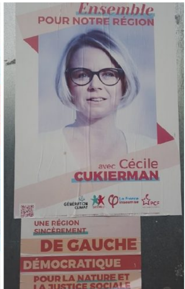
Sans doute les affiches les plus tristes des Régionales : « L'avenir en toutes sécurités » (?) pour NVB et « Ensemble pour notre région » (PC-LFI), « une région sincèrement de gauche démocratique, pour la Nature et la justice sociale »