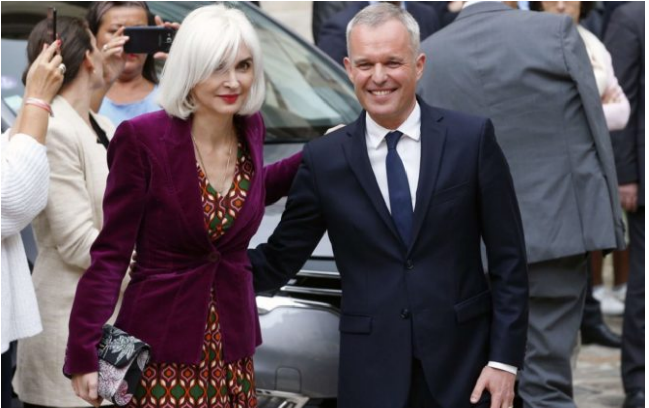
Le très mondain couple de Rugey amateur de homard et de champagne du temps du ministère de la Transition écologique