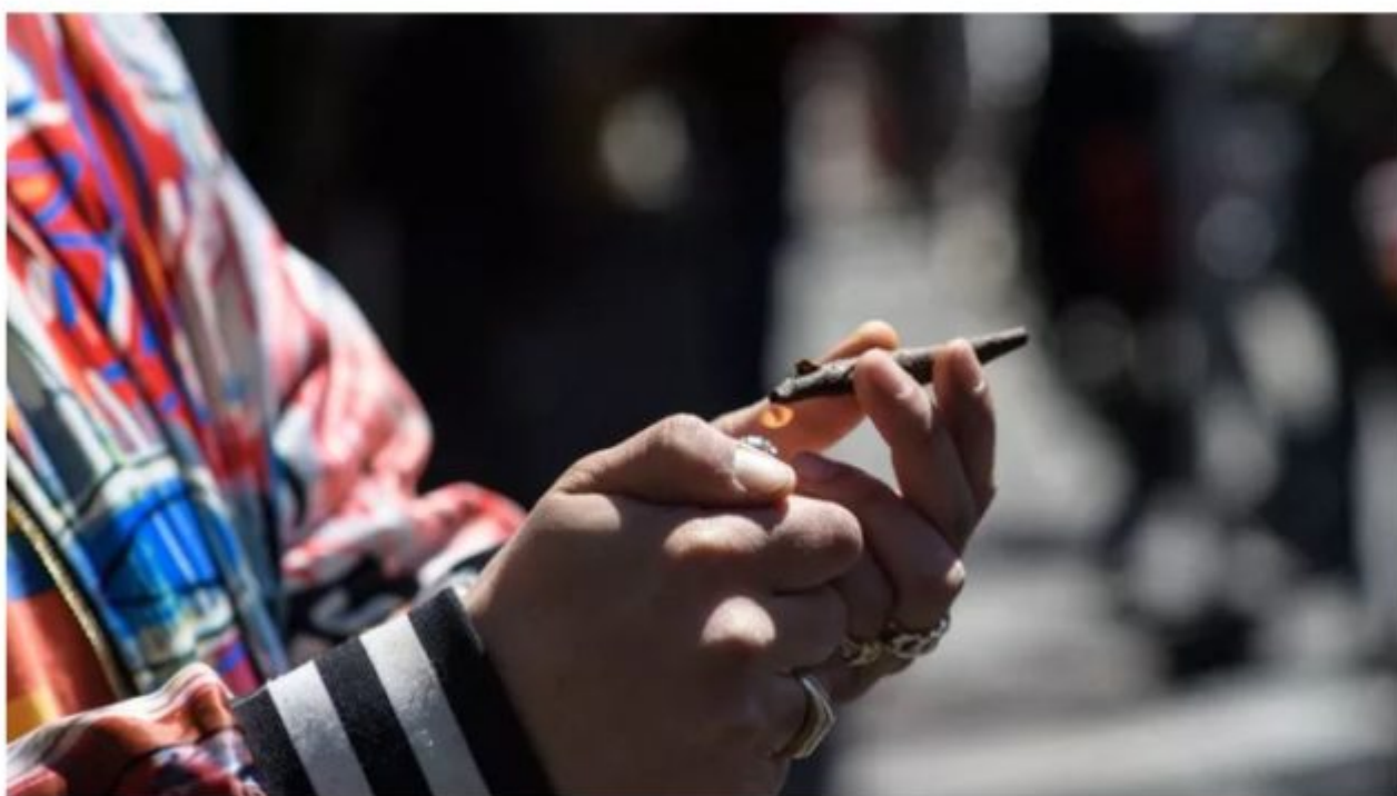
L'État de Washington a légalisé l'usage du cannabis à titre récréatif en 2012.