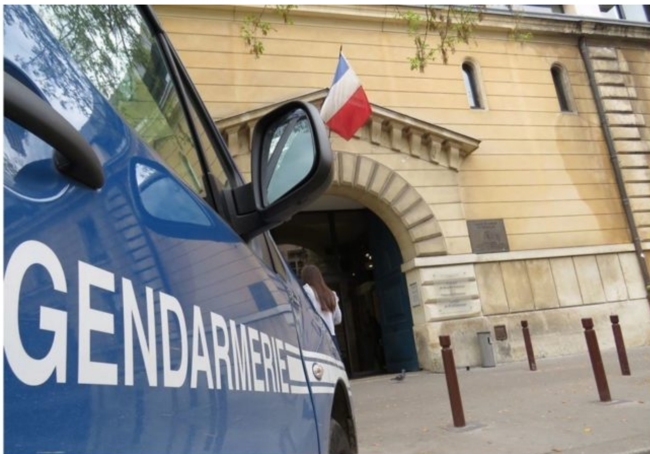
Les gendarmes ont conduit un homme de 23 ans au tribunal de Versailles. Rigoriste, il considérait que l'adultère méritait la peine de mort.

Yvelines. Le mari rigoriste considérait que l'adultère méritait la peine de mort