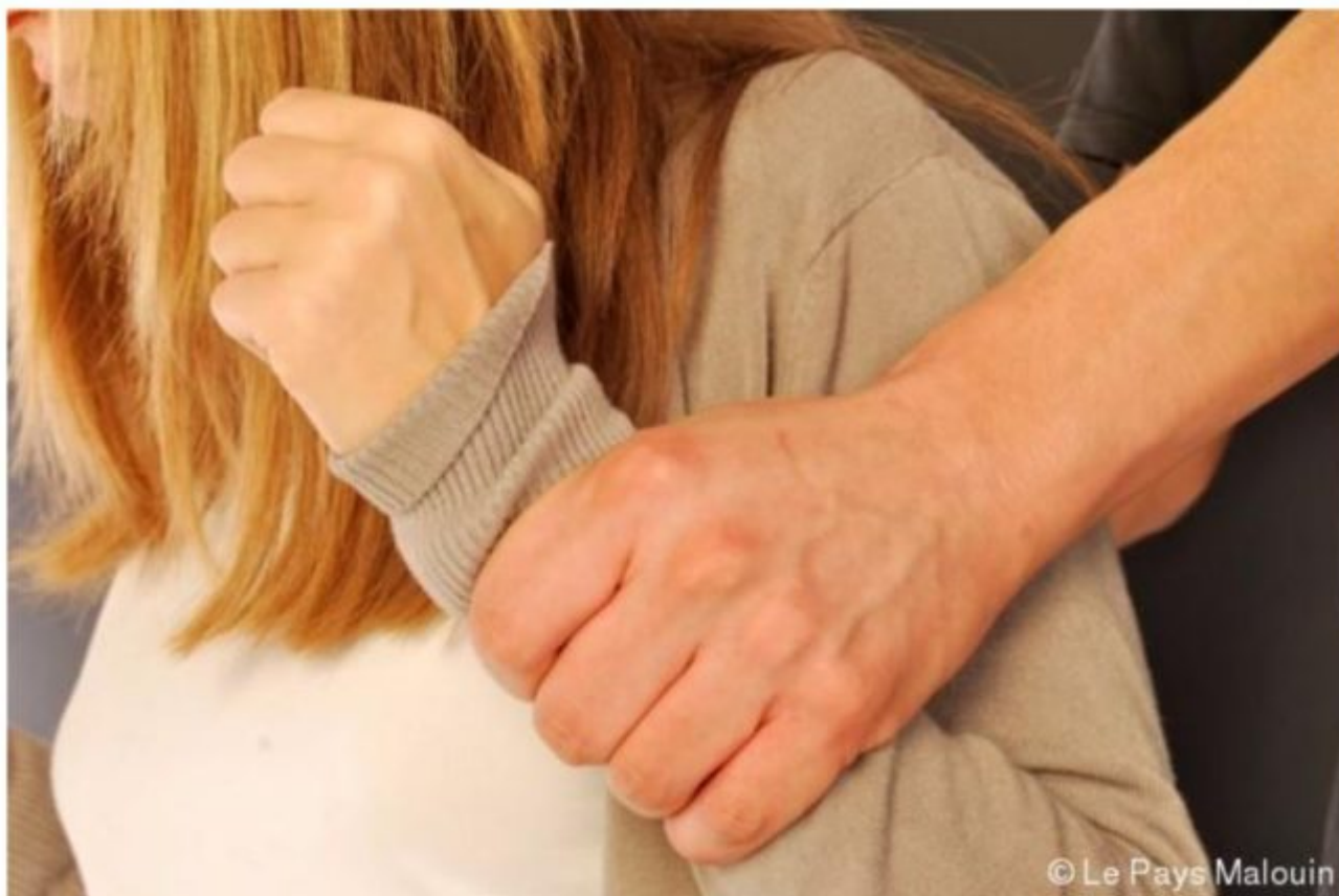
La jeune femme, âgée de 20 ans était séquestrée depuis deux mois par sa famille.

Comme une bouteille à la mer, cette jeune femme âgée de 20 ans a laissé tomber hier, depuis le haut de son immeuble situé Allée des Yvelines à Trappes, un bout de papier, espérant sûrement qu'une personne bienveillante le récupère.