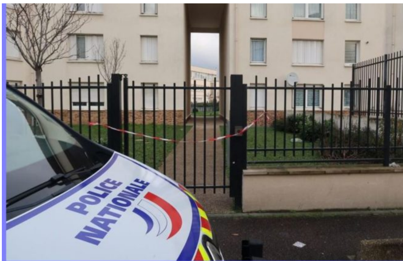
Illustration. Limay. La police a interpellé deux proxénètes et violeurs présumés dans cette commune du nord des Yvelines.

Limay : prostituée pendant trois jours, elle réussit à s'enfuir de l'appartement de l'horreur