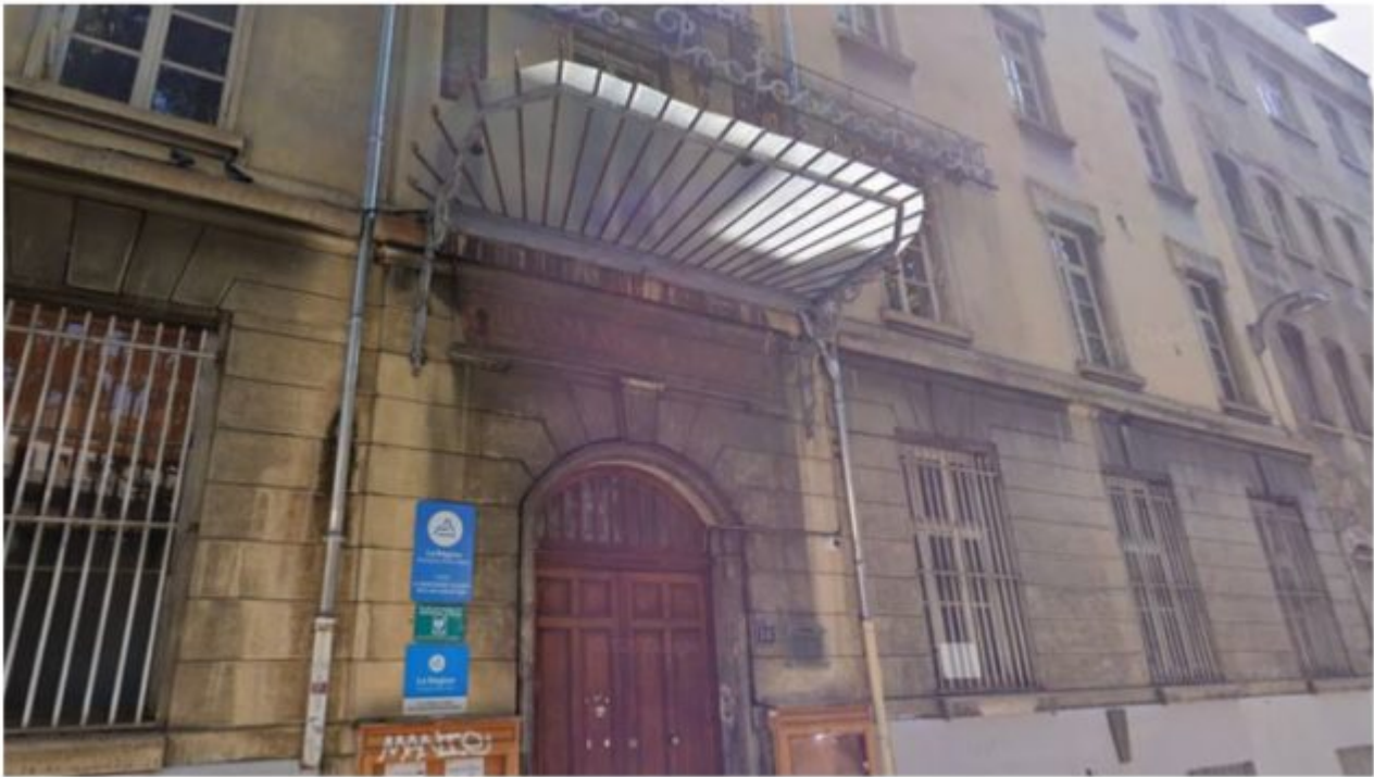
Le lycée La Martinière-Diderot, à Lyon.

Elle a été ciblée parce qu'elle sortait avec un non-musulman.