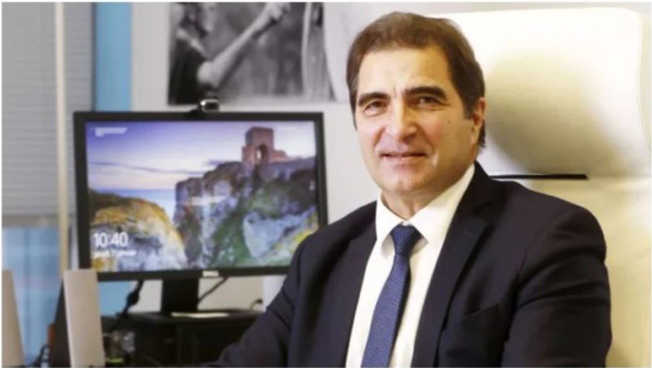
Christian Jacob, président des Républicains, dans son bureau à Paris en janvier.