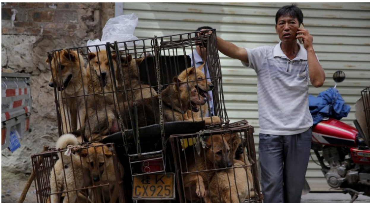
Marchand de chiens au marché de Yulin, célèbre pour son festival de viande de chien. Guangxi, Chine, 2016.

Idem pour l'origine du Covid-19 : il faut répéter dogmatiquement que "le virus provient du marché au poisson de Wuhan et que c'est la faute... du pangolin ou de la chauves-souris". Point, fermez le ban.