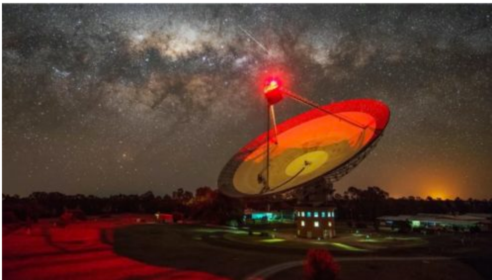
Le radiotélescope Parkes, en Australie.

Ainsi, alors que le SETI écoute l'Univers pour détecter d'éventuels signaux extraterrestres, METI se concentre sur une approche plus active : émettre des messages dans l'espoir de susciter des réponses. «Imaginez si toutes les civilisations ne faisaient qu'écouter sans transmettre le moindre signal... Ce serait un univers incroyablement calme » , souligne Douglas Vakoch, le Président de l'institut.