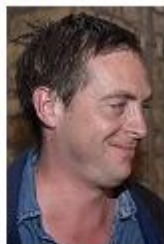
Stephen Campbell Moore