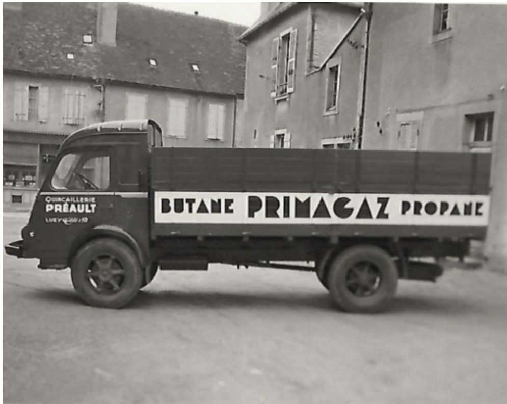
CAMION RENAULT « FAINÉANT » 1950 PRIMAGAZ.