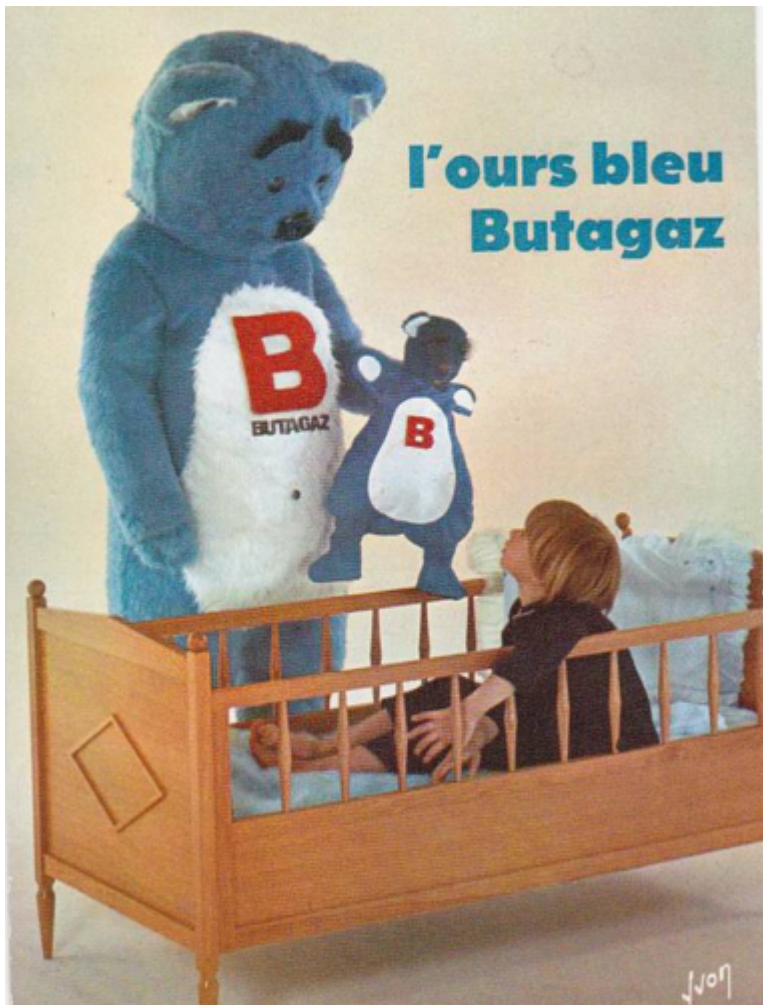
L'ours bleu Butagaz (au service du confort) Butane-Propane, années 1960