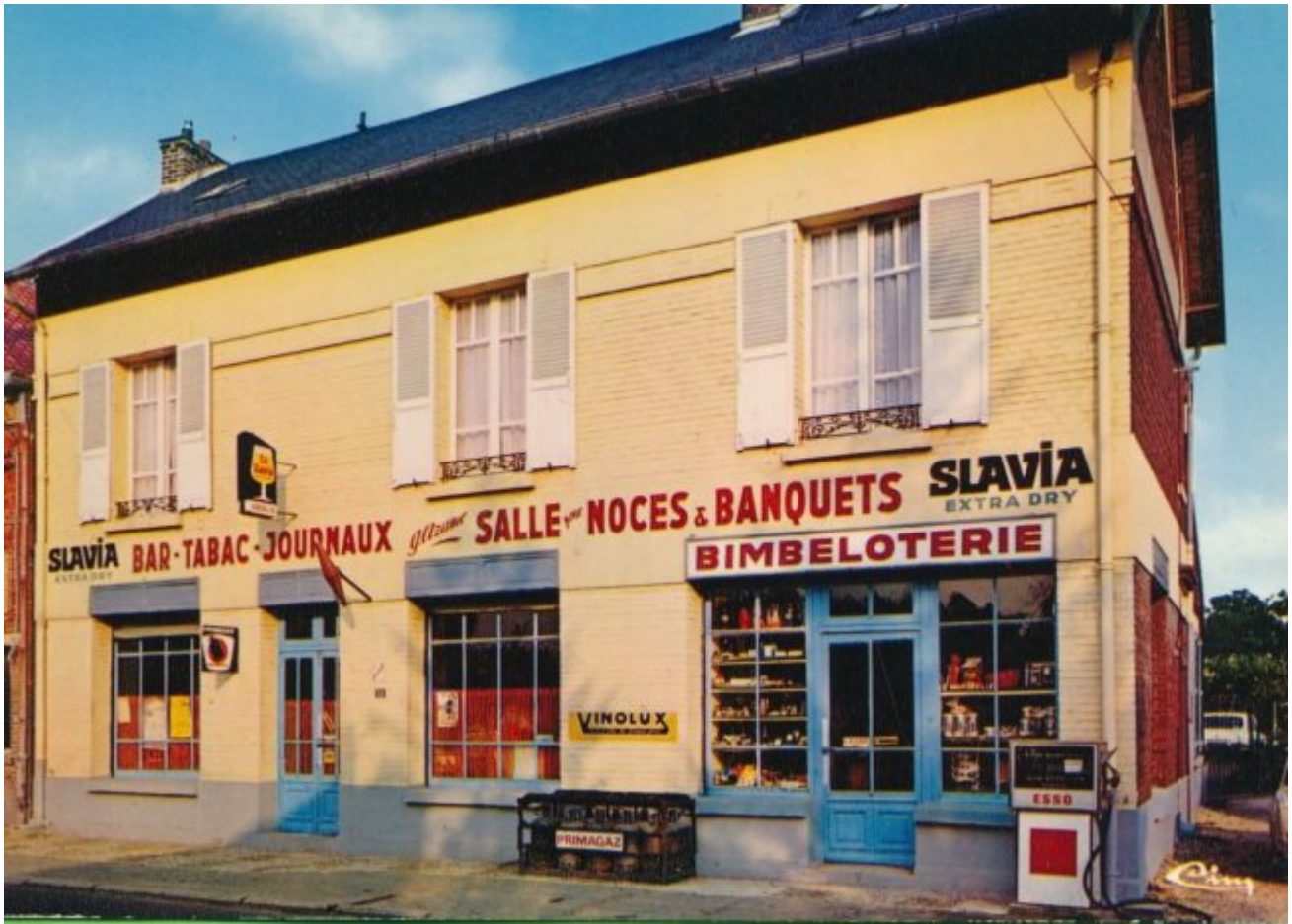
02 Marizelle-Bichancourt Tabac Le Marizelle Bouteilles de gaz