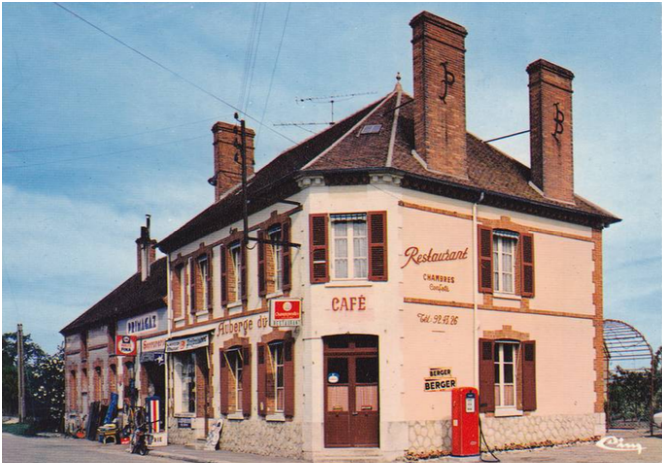
45 La Cour Marigny L'AUBERGE DU SOLIN