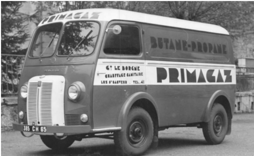
FOURGON PRIMAGAZ DE LA SOCIETE LE BORGNE CHAUFFAGE SANITAIRE A LUZ SAINT SAUVEUR