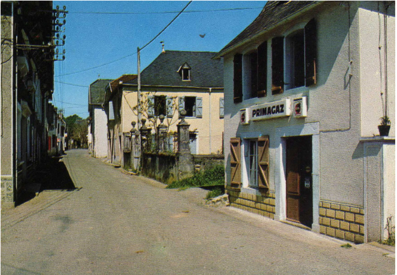
64 Lucq de Bearn, rue principale Dépôt de Gaz PRIMAGAZ.