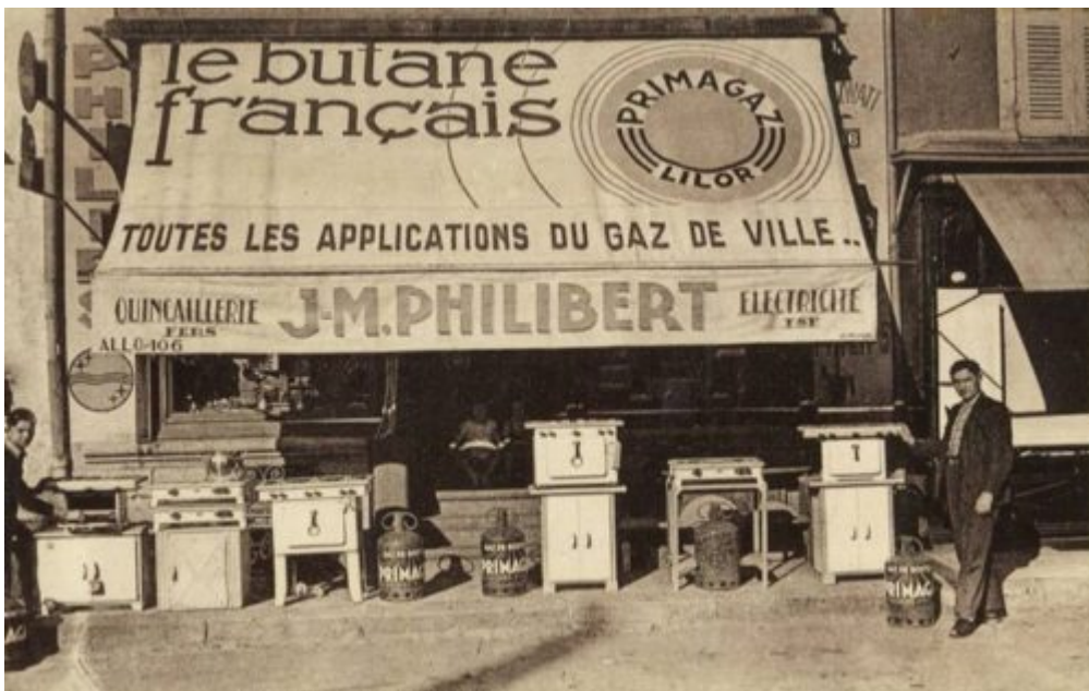
43 HAUTE LOIRE Devanture de magasin butane français Primagaz Quincaillerie Electricité Philibert