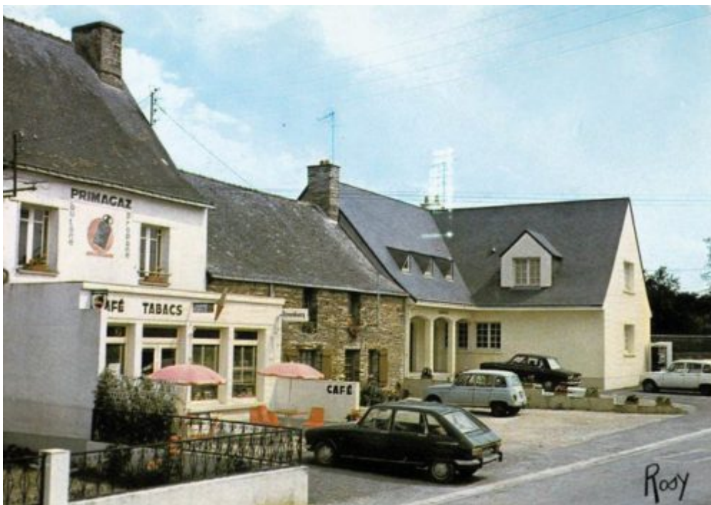
Sévérac (44 ) Place et nouvelle mairie