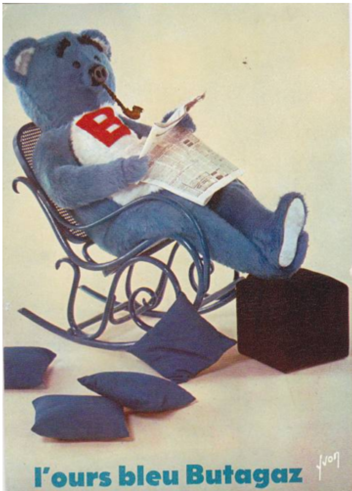
L'ours bleu Butagaz (au service du confort) Butane-Propane.