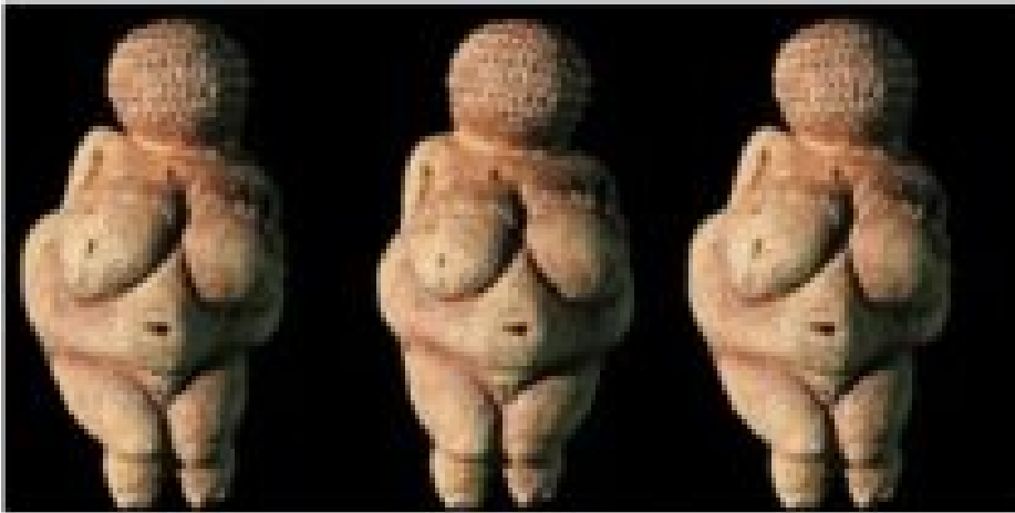
La statuette en pierre de 20000 ans, © Capture d'écran Twitter (@gustavocosta)