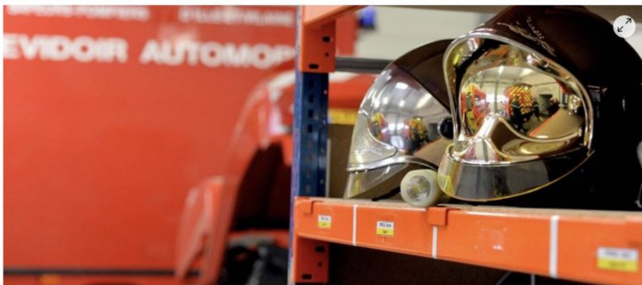
Dans la nuit du 13 au 14 mai, à Brest, des pompiers ont été pris à partie alors qu'ils intervenaient sur des incendies de voiture dans le quartier de Pontanezen.