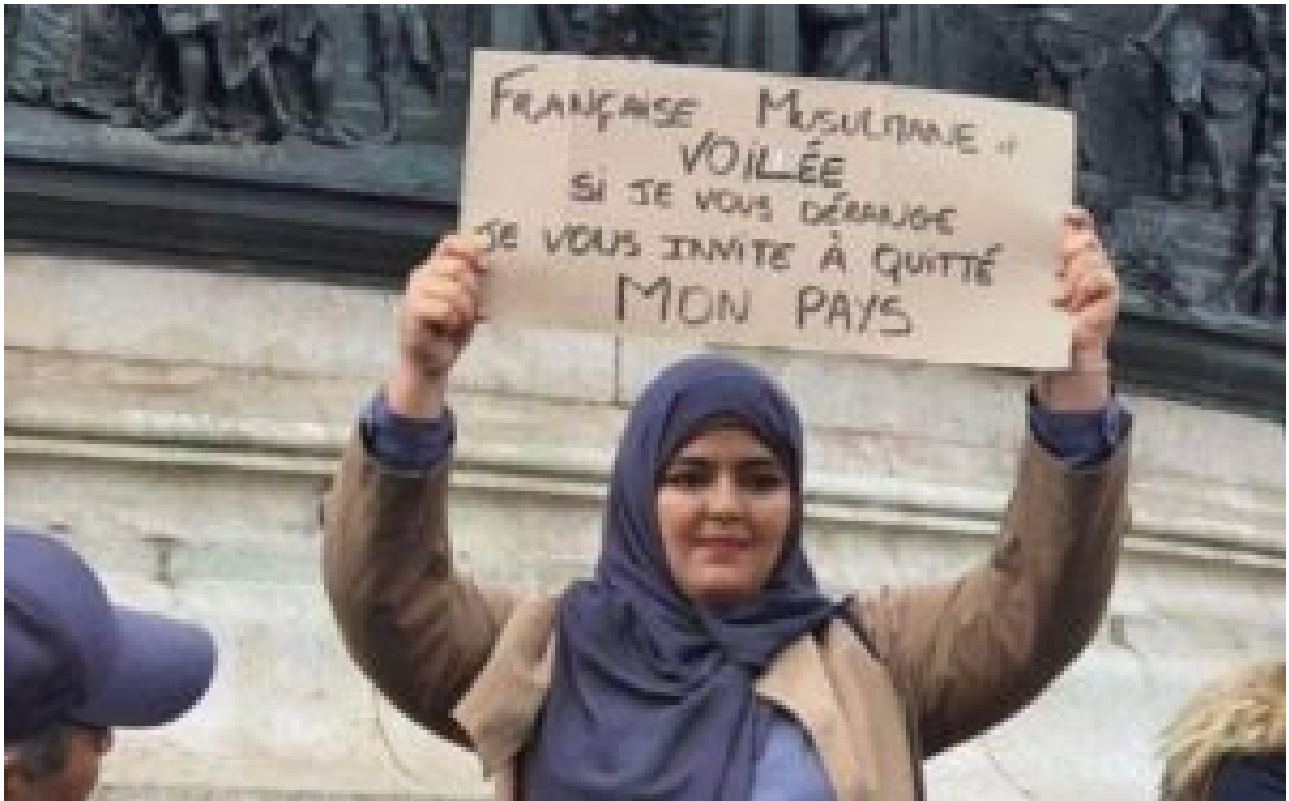
Manifestante à la marche contre l'islamophobie (novembre 2019)