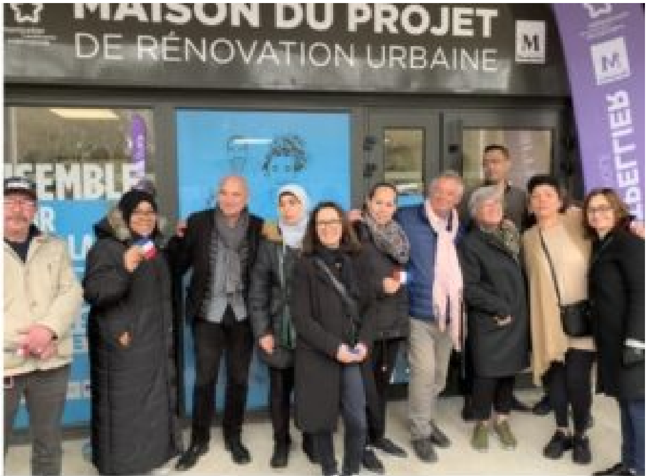
La Maison du projet de rénovation urbaine a été inaugurée mardi. (HCFM)

Les musulmans du quartier de la Paillade-mosson (où « Pierre » ne vit plus), à Montpellier, sont heureux : ils bénéficieront d'une rénovation à un milliard d'euros . Pour autant, les mentalités changeront-elles ?