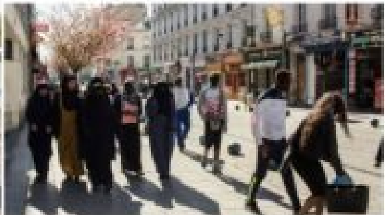
un tiers de cette ville sont 30 personnes musulmans appartenant par les données de 2009 selon une étude L'observatoire de la ville de Paris