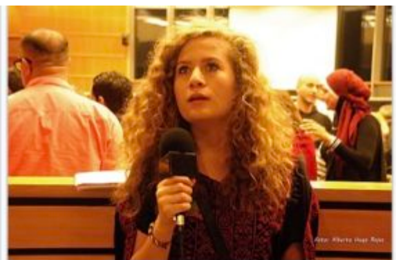
A. Tamimi lors de la Conférence au Parlement européen sur « Le rôle des femmes dans la Résistance populaire palestinienne », septembre 2017

La championne toute catégorie du genre était la jeune “Shirley Temple palestinienne” Ahed Tamimi, elle frappait des soldats ou les giflait en attendant de recevoir la baffe en retour, tout ça dûment filmé et “retravaillé au montage”. Histoire de présenter une “armée d’occupation” qui brutalise les civils.