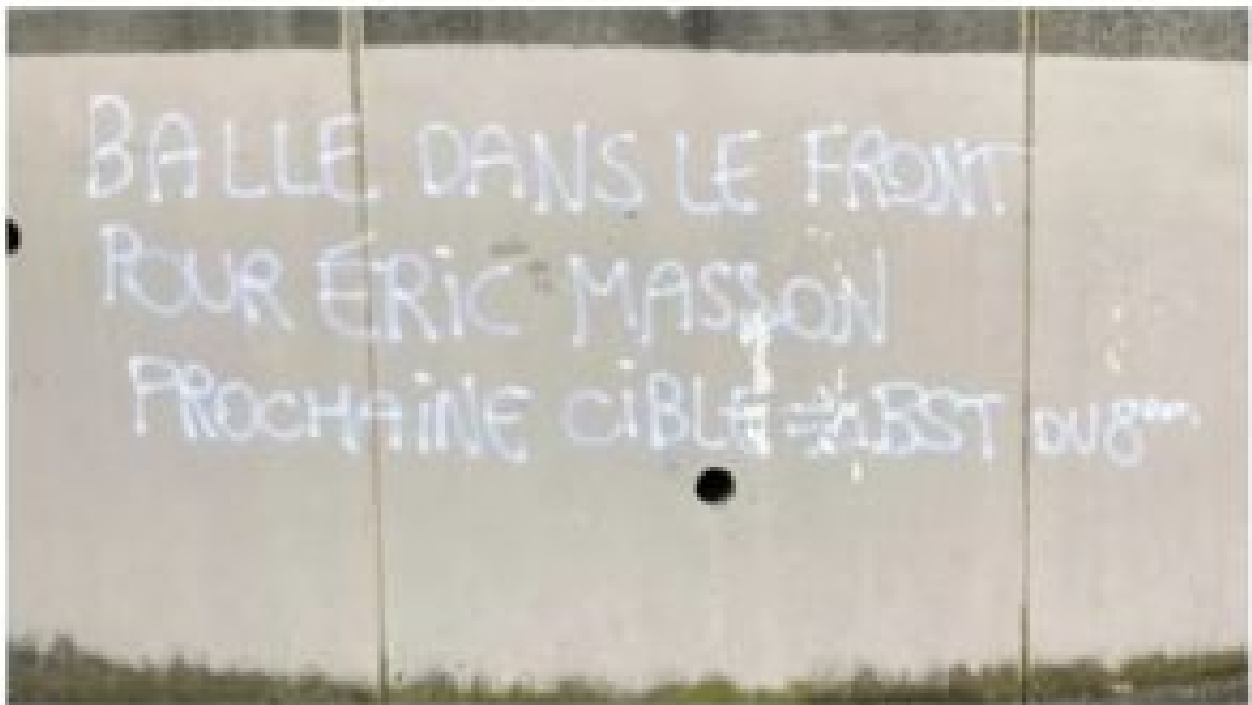
Un tag anti-police découvert lundi 10 mai 2021 à Lyon.

Et les nouveaux tags anti-flics découverts à Lyon , c'est qui ? Ben des Français lyonnais de France , pardi !