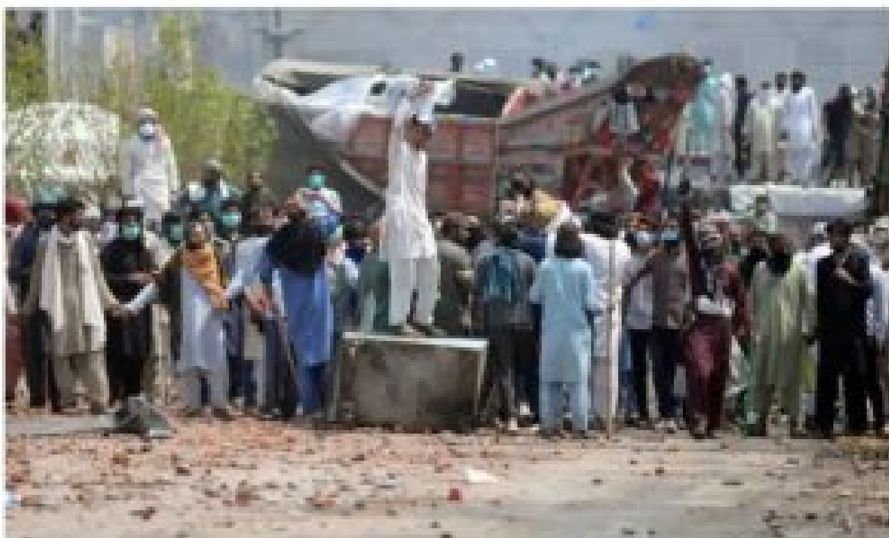
▲ Supporters of the banned Islamic fundamentalist party Tehreek-e-Labbaik Pakistan (TLP) block a road during the protest in Lahore, Pakistan.

Fresh violence breaks out as TLP calls for action over 'blasphemous' cartoons in Charlie Hebdo magazine