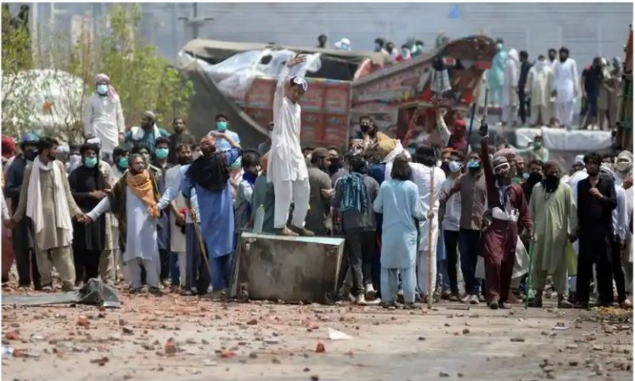
▲ Supporters of the banned Islamic fundamentalist party Tehreek-e-Labbaik Pakistan (TLP) block a road during the protest in Lahore, Pakistan.

Fresh violence breaks out as TLP calls for action over 'blasphemous' cartoons in Charlie Hebdo magazine