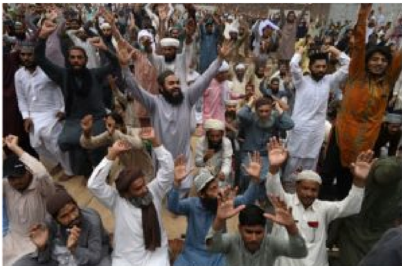
Supporters of extremist political party Tehreek-e-Labbaik Pakistan (TLP) chant slogans as they block a street during a protest after their leader was detained following his calls for the expulsion of the French ambassador, in Lahore on April 16, 2021.