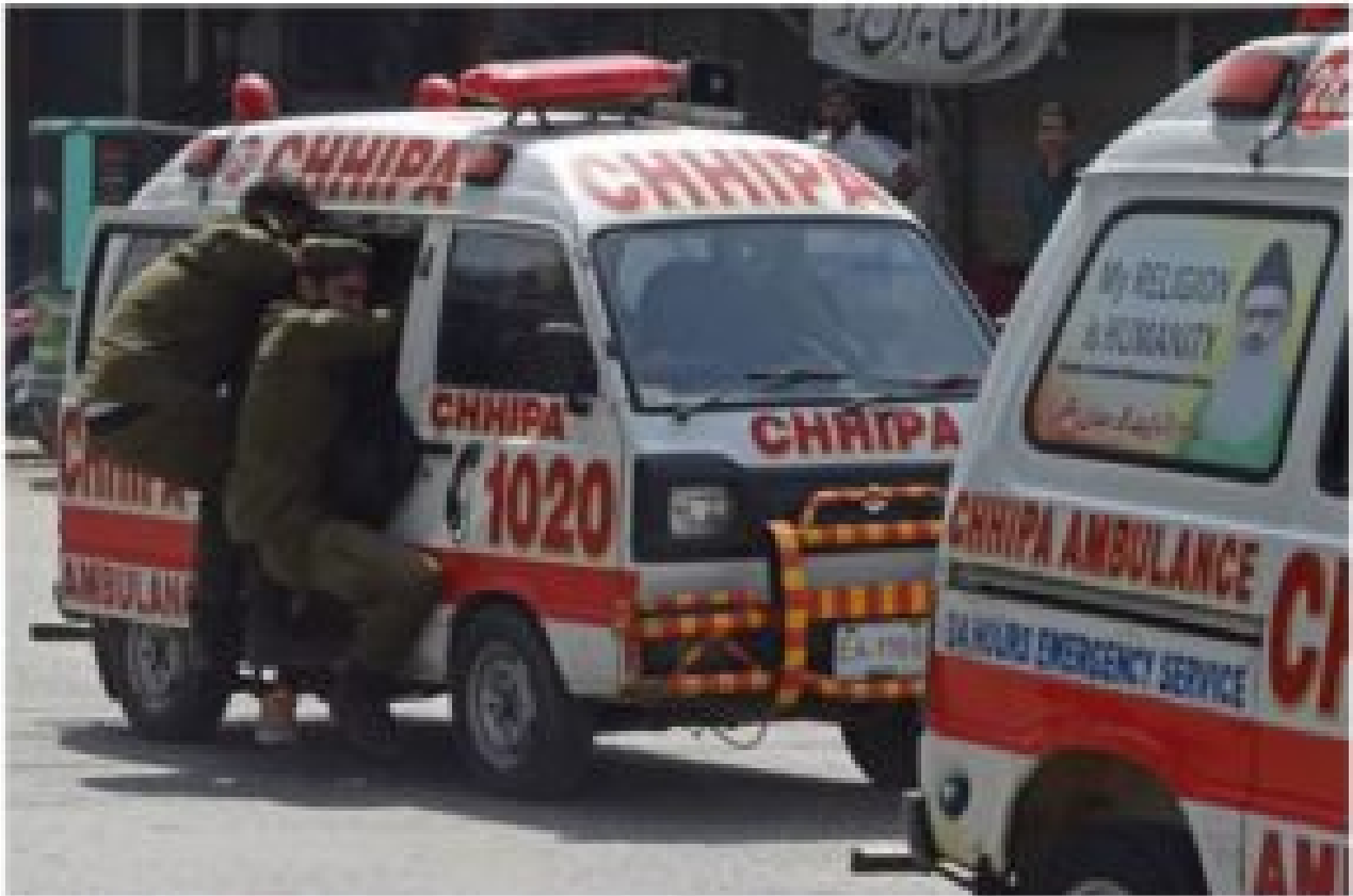
Des policiers quittent une ambulance après un affrontement avec les partisans du parti Tehreek-e-Labbaik Pakistan (TLP) lors d'une manifestation après l'arrestation du leader de leur parti suite à ses appels à l'expulsion de l'ambassadeur français, à Lahore le 18 avril 2021.