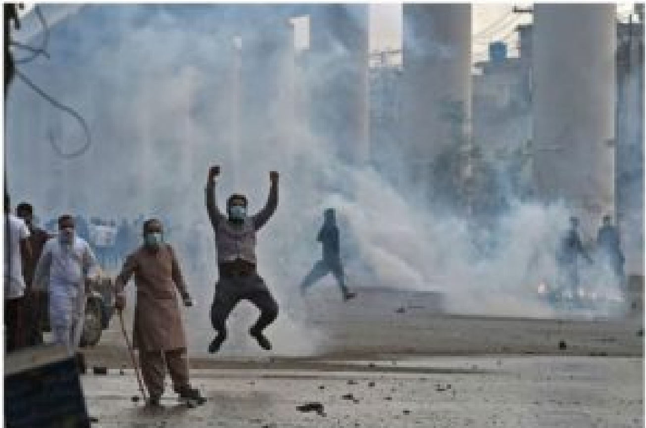
Pakistan Civil War 2021. A message was sent to all French citizens in Pakistan