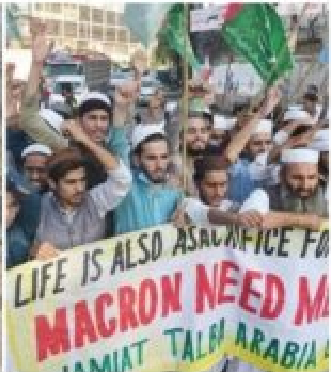
Pakistan Civil War 2021. What is going on in France right now?