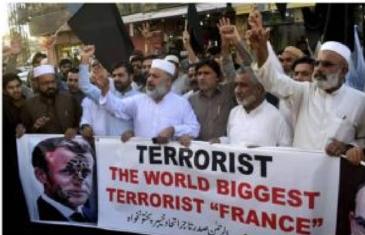
Des Pakistanais ont manifesté lundi 26 octobre 2020 contre la publication de caricatures du prophète Mahomet en France, qu'ils jugent blasphématoires.

https://www.lefigaro.fr/flash-actu/au-moins-sept-policiers-pakistanais-pris-en-otage-par-des-manifestants-anti-france-20210418