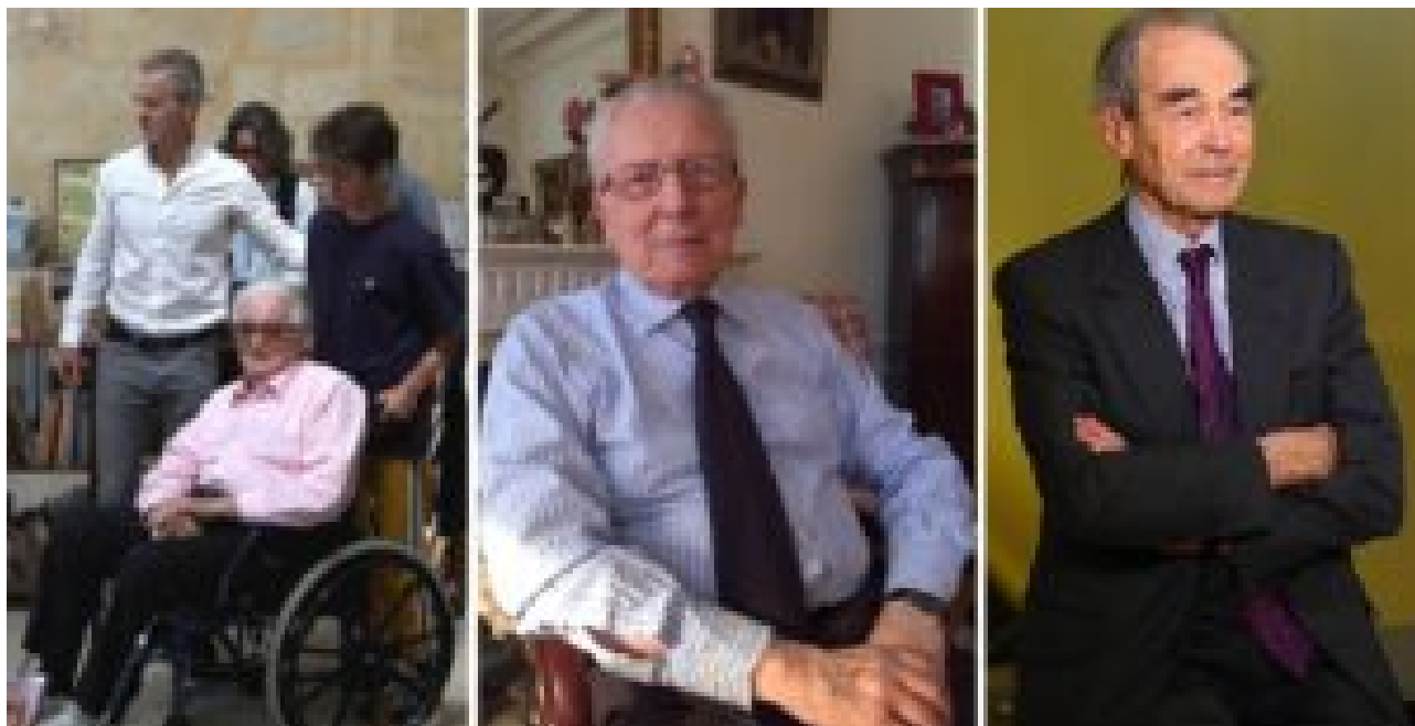
Dumas (98 ans), Delors (95 ans), Badinter (93 ans)

Et puis un peu de compassion envers les simples Français traités de beaufs populistes mais devant se coltiner la violence de leur "diversité" chérie, serait-ce trop leur demander ?