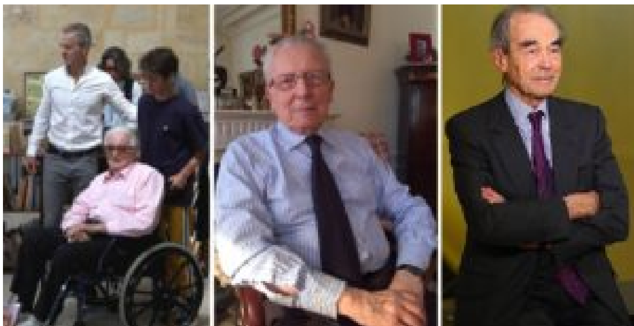
Dumas (98 ans), Delors (95 ans), Badinter (93 ans)

Et puis un peu de compassion envers les simples Français traités de beaufs populistes mais devant se coltiner la violence de leur "diversité" chérie, serait-ce trop leur demander ?