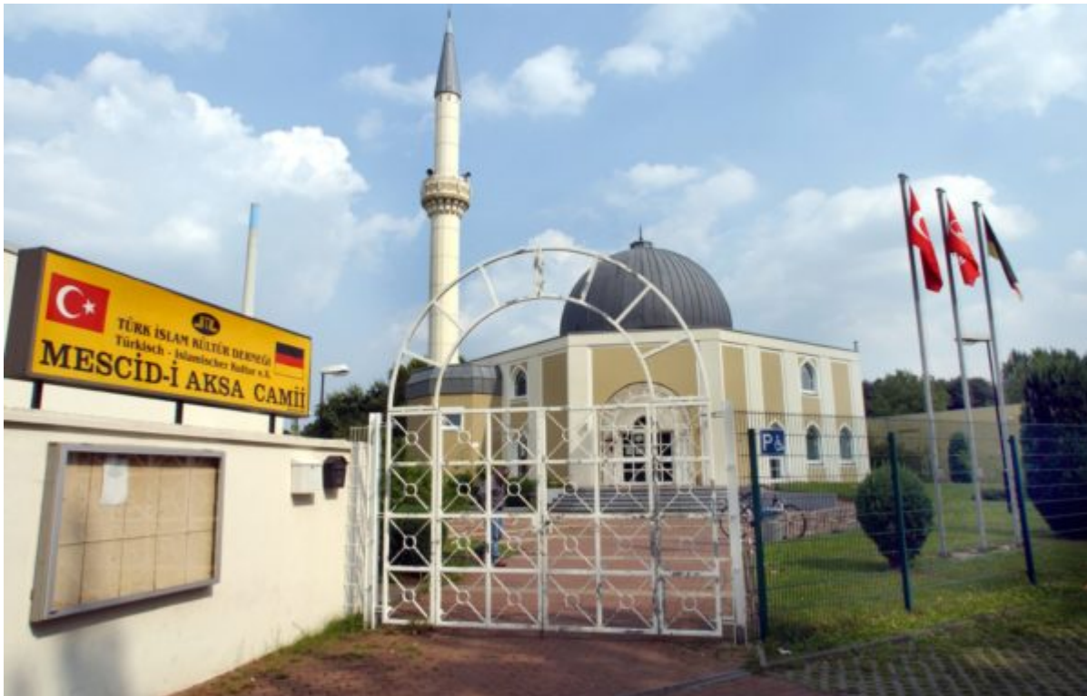
Vue de la mosquée turque Al Aksa à Gelsenkirchen, commune dans laquelle a eu lieu l'incendie de l'église.