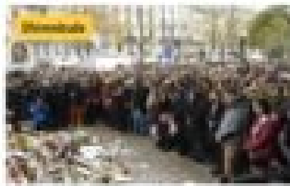
Politique Le 17 novembre 2017 par Christine Tassin Pour Pascal Boniface, les morts de Bataclan c'est de la gnognotte, le vrai problème c'est l'alcool