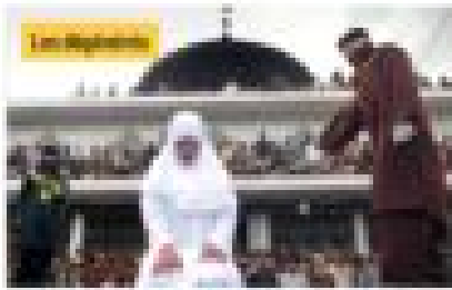
Les Religions Le 20 octobre 2019 par Christine Tassin 50 colonialistes, Omar Sy, Delphy, Boniface... considèrent les musulmans comme des sous-hommes