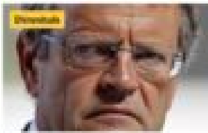
Politique Le 20 août 2019 par Christine Tassin Y a pas de sécurité pour ta grande, fils de pute : l'anti-sioniste Pascal Boniface accueilli en Israël