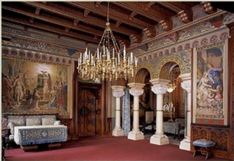
Salle du séjour