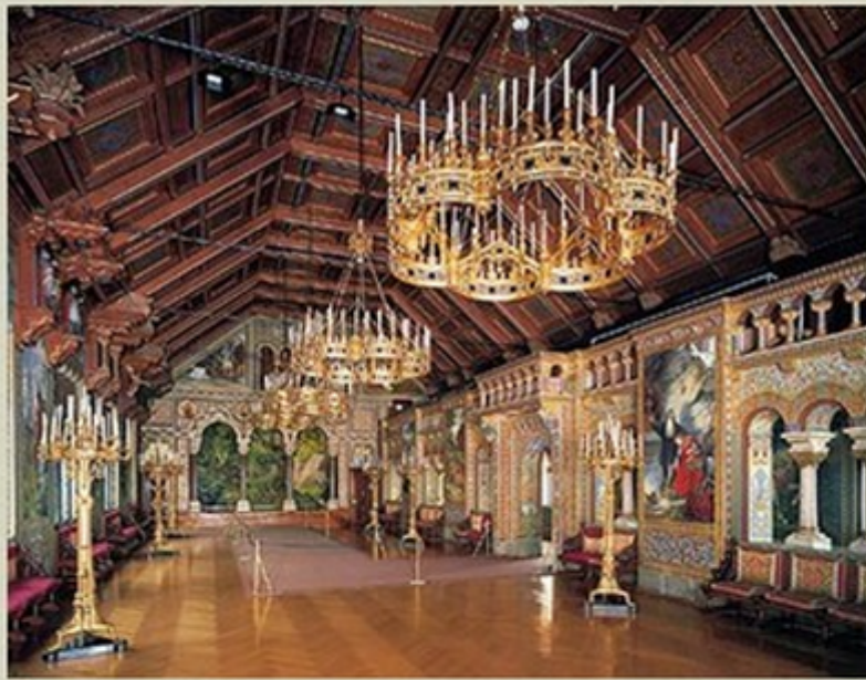
Salle des chanteurs