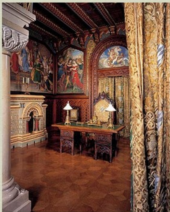
Cabinet de travail