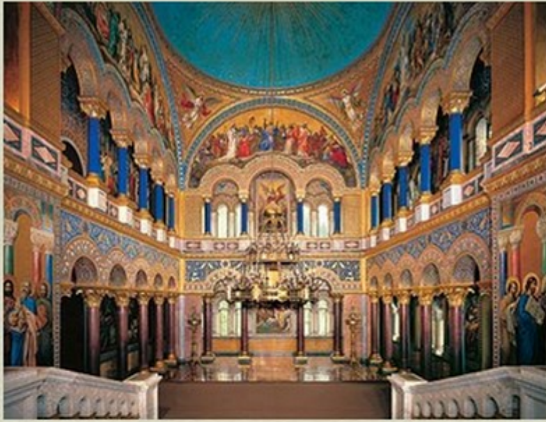
Salle du trône