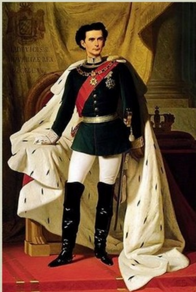
Louis II de Bavière