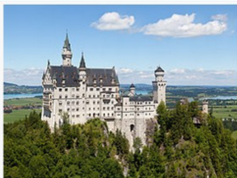
Château de Neuschwanstein