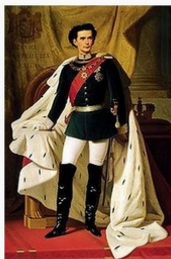
Louis II de Bavière par Ferdinand von Piloty (1865)