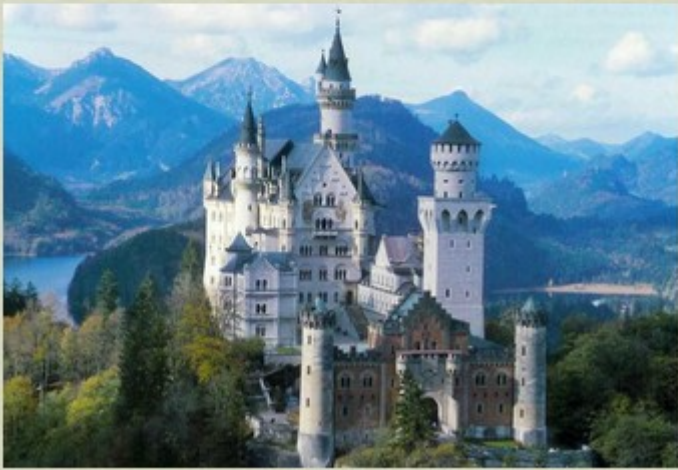
Château de Neuschwanstein