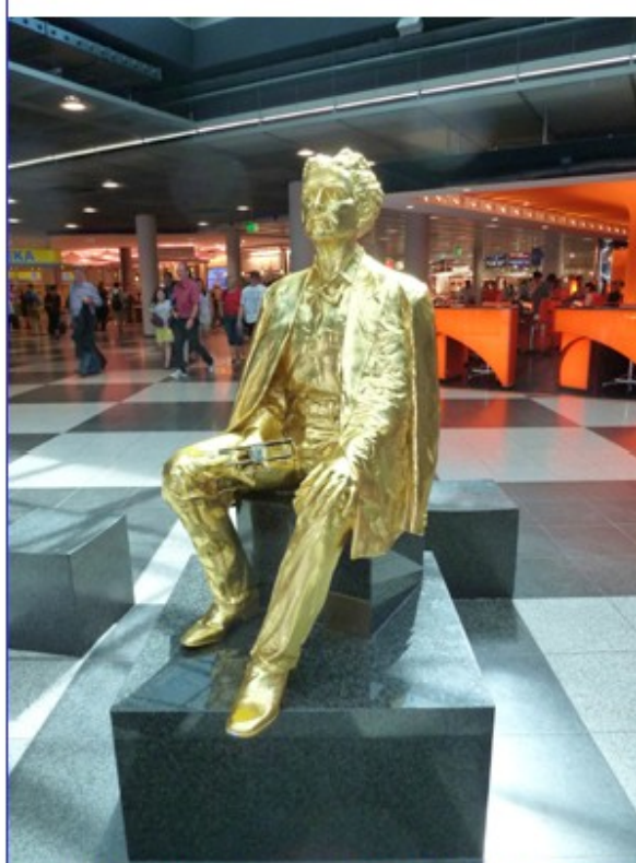
Louis II de Bavière