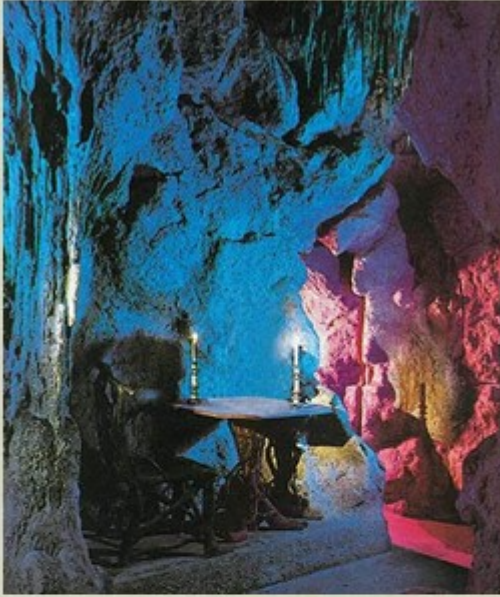
Grotte et jardin d'hiver