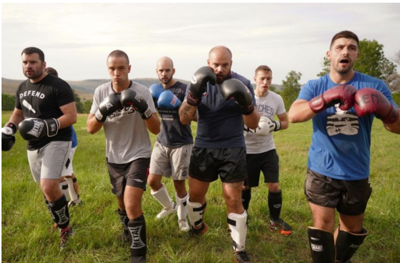
Photo : des gars s'entraînant à la boxe dans le Cantal ou Thais d'Escufon escaladant un arbre ? Non, une dangereuse milice paramilitaire pour France Info

écrit par François des Groux | 6 mars 2021