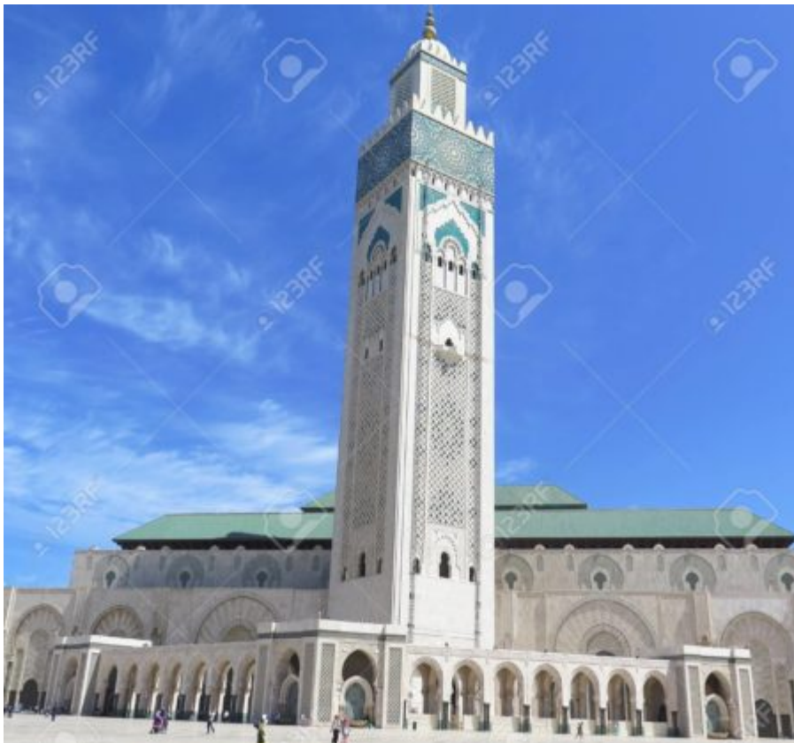
Mosquée Hassan II au Maroc

L'UE se pose en modèle du « développement humain, y compris l'égalité hommes-femmes ».