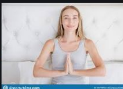
Femme Blanche De Sourire ...