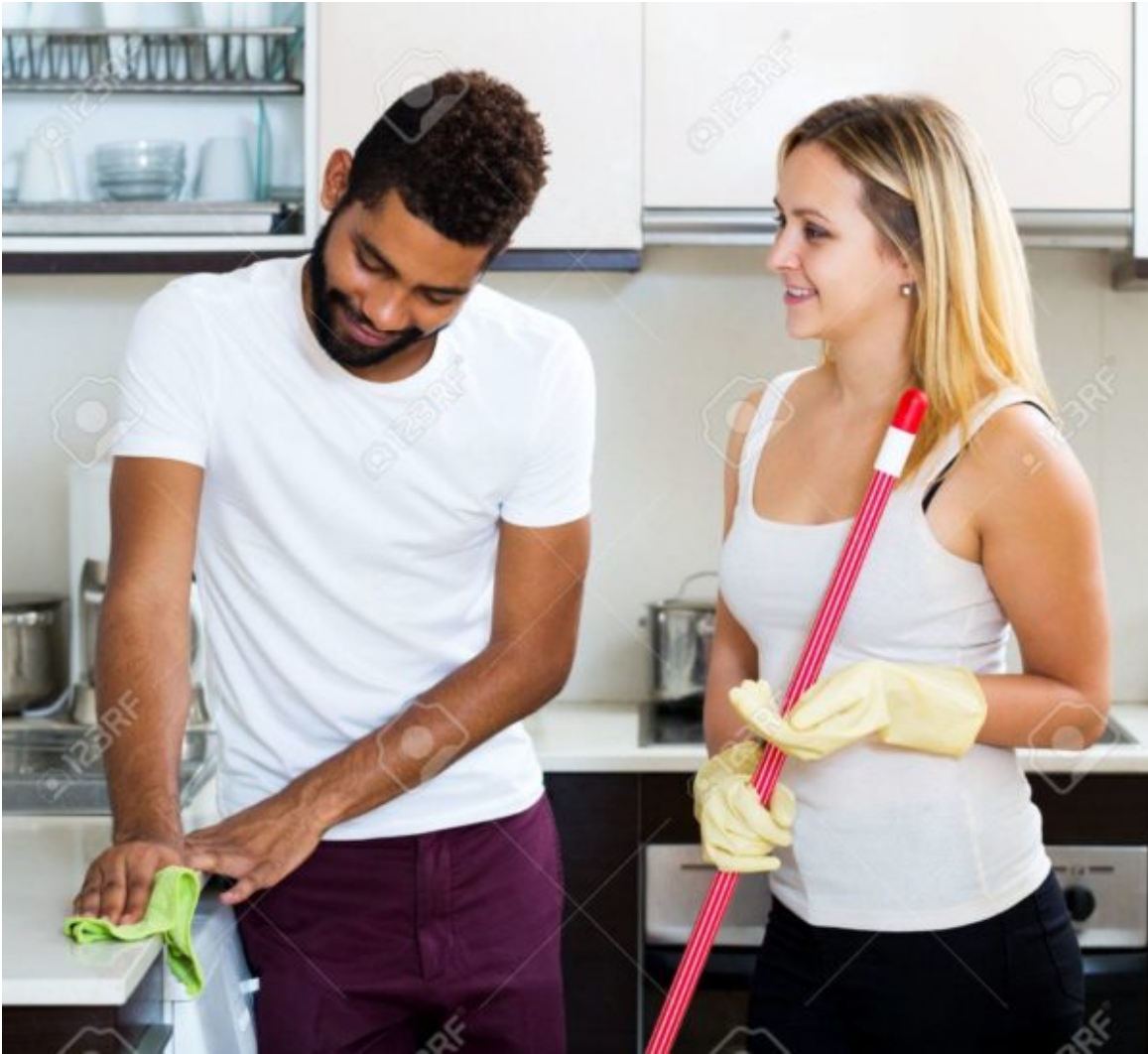
Black man with happy white woman dusting in domestic kitchen

Et les images similaires proposées par Google si l'on clique sur cette première image :