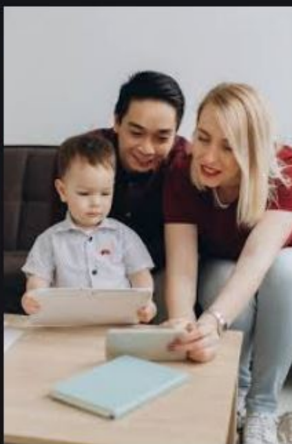
Famille Multiculturelle Heur...