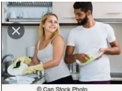
Noir, blanc, femme, amour, ...