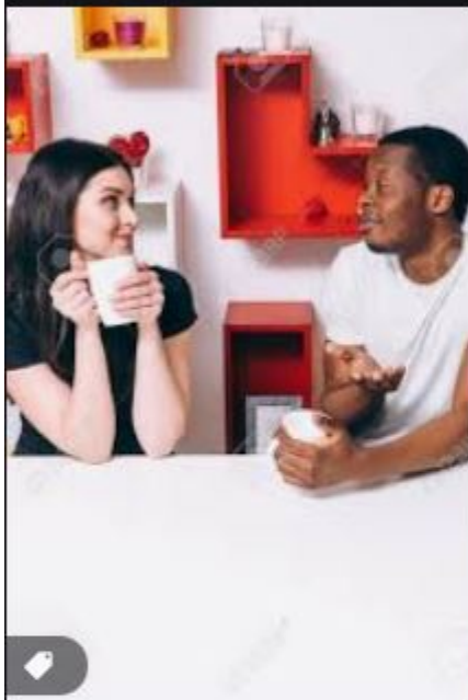
Jeune Couple International