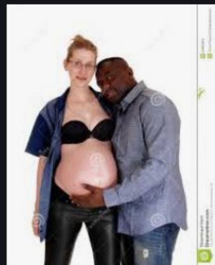
Femme Enceinte Avec Son ... fr.dreamstime.com

Comment Google tente d'accoupler des femmes blanches avec des hommes noirs ?