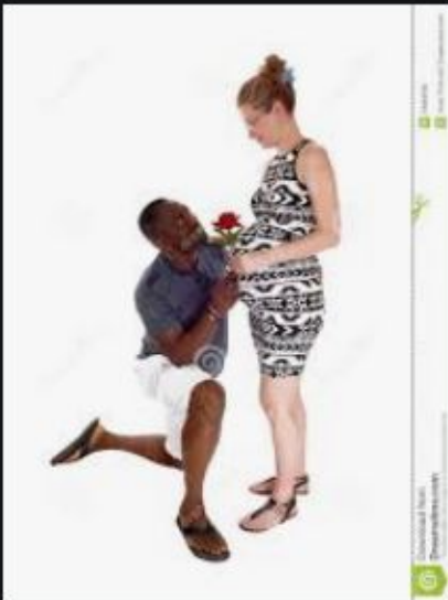
Homme De Couleur Se Mett...