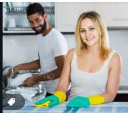
Black Man With Happy Rus...