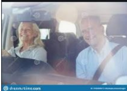
Femme Blanche Supérieure...