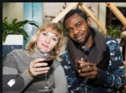
Portrait De Couple Heureux