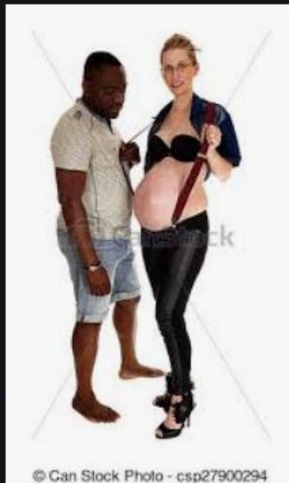
© Can Stock Photo - csp27900294