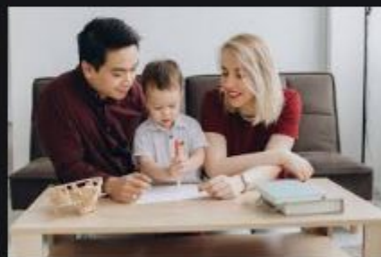
Famille Multiculturelle Heur...