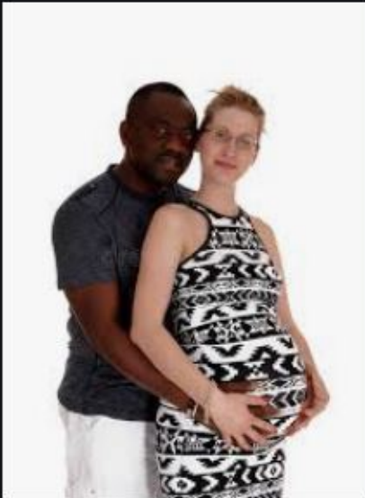
Plan Rapproché D'homme D...