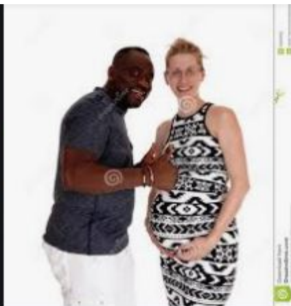
Femme Blanche Heureuse ...