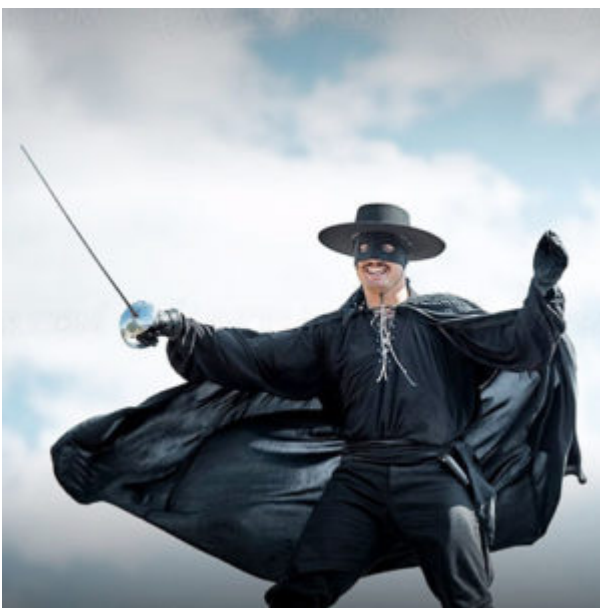
Zorro avec son masque et son sombrero.

Profitez-en, tout est appelé à disparaître tôt ou tard !