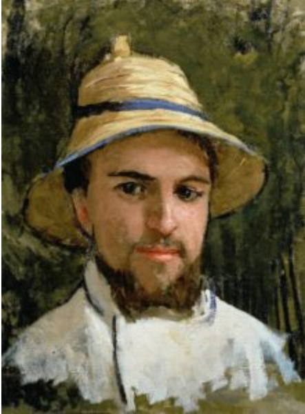
Autoportrait avec Casque Colonial de Gustave Caillebotte.

En 2018 : Melania Trump attaquée pour son élégance et ses tenues safari.