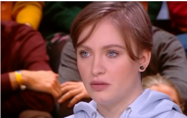
MILA : "JE N'AI RIEN FAIT DE MAL"

Mais ce sera encore mieux si plusieurs internautes résistants en ciblent seulement quelques uns chacun car les colonels-directeurs pourront tous constater que la résistance est nationale (et même internationale s'il y a des expatriés qui nous lisent et participent).