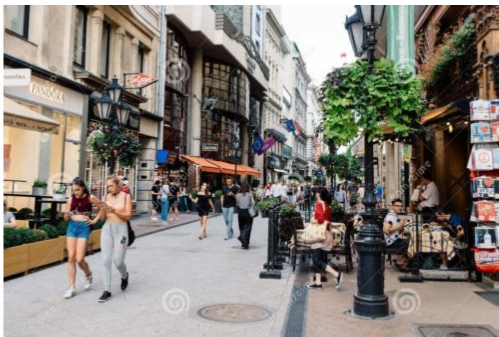
Rue commerçante à Budapest

https://english.alaraby.co.uk/english/news/2020/12/3/hungary-jails-syrian-is-commander-over-imam-beheading