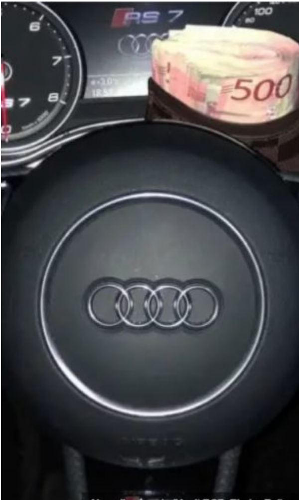
L'Audi RS7 de Blattelito.