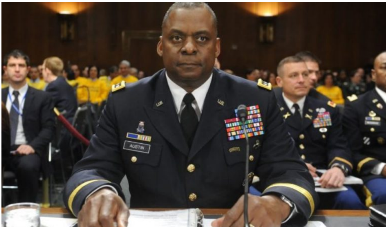
Illustration : Lloyd Austin, futur “ premier ministre de la Défense afro-Américain ” s’enthousiasme Le Figaro (avec l’Afp)

écrit par François des Groux | 8 décembre 2020