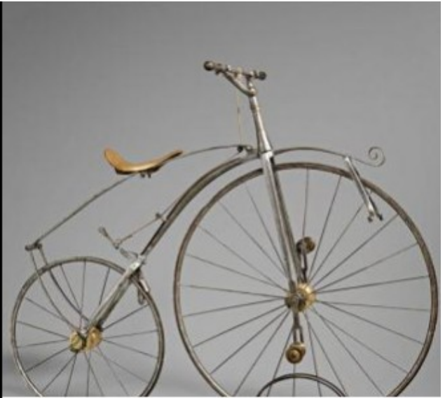
VÉLOCIPÈDE À ROULEMENT À BILLES