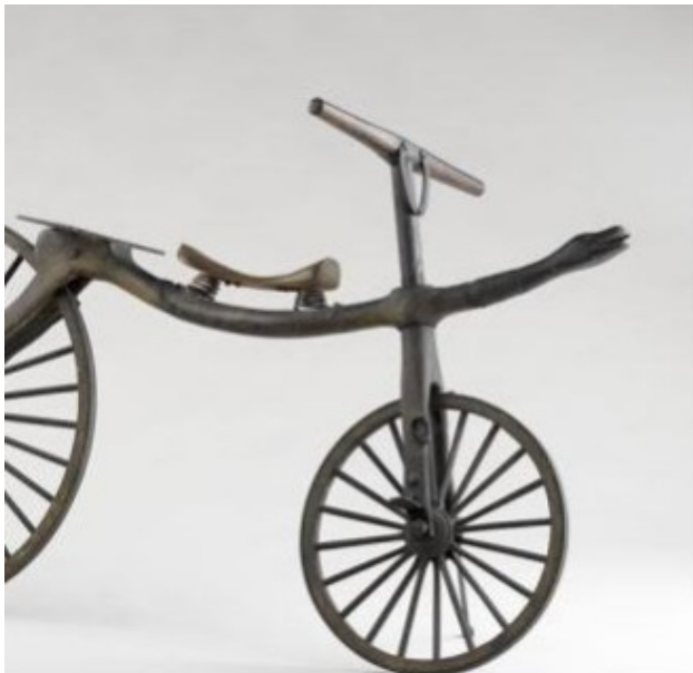
DRAISIENNE À TÊTE DE SERPENT