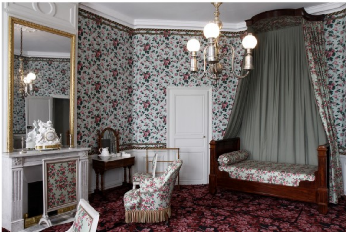
Chambre de l'appartement d'invité n° 34

Ci-dessous, la galerie Natoire servant de salle à manger