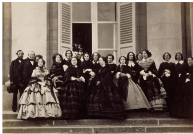
Delessert E, L'impératrice Eugénie et les dames de la 3ème Série de 1856

Dès lors, le nouveau couple impérial va rendre au palais tout son faste. En effet, à partir de 1856 et jusqu'en 1869, les souverains y séjournent trois à six semaines à l'automne et y organisent les célèbres "Séries de Compiègne", Chaque série dure une semaine et comporte une centaine d'invités qui sont logés au château. Il faut savoir que ces "Séries de Compiègne" sont très célèbres et, aux yeux du grand public, c'est souvent la seule chose connue du château de Compiègne.