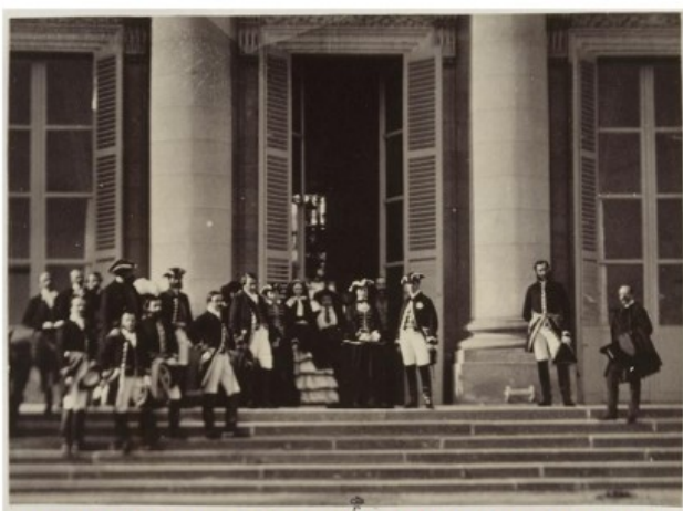
Aguado, L'impératrice Eugénie et ses hôtes en tenue de vénerie, 1856

Personnalités proches du pouvoir, souverains ou princes étrangers, diplomates, écrivains, artistes, scientifiques se retrouvaient dans la quasi intimité de la famille impériale. Chasses, excursions, jeux, concerts et pièces de théâtre occupaient les journées où l'on oubliait les contraintes de l'étiquette. "Oubliait les contraintes de l'étiquette" signifie que tous les rangs de noblesse ou autres sont laissés de côté, chaque personne étant égale à l'autre.