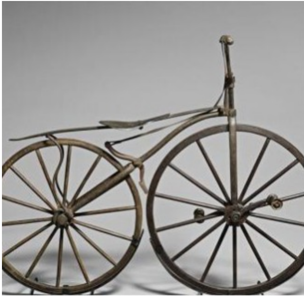
VÉLOCIPÈDE À ROUE LIBRE