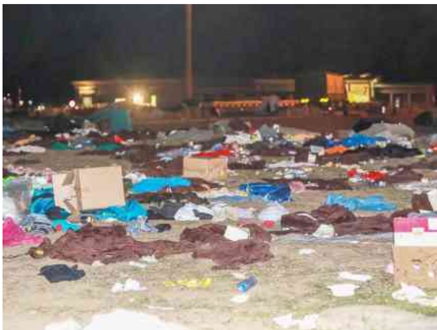
Illustration : la culture de l'accueil inconditionnel.

écrit par Jules Ferry | 20 novembre 2020