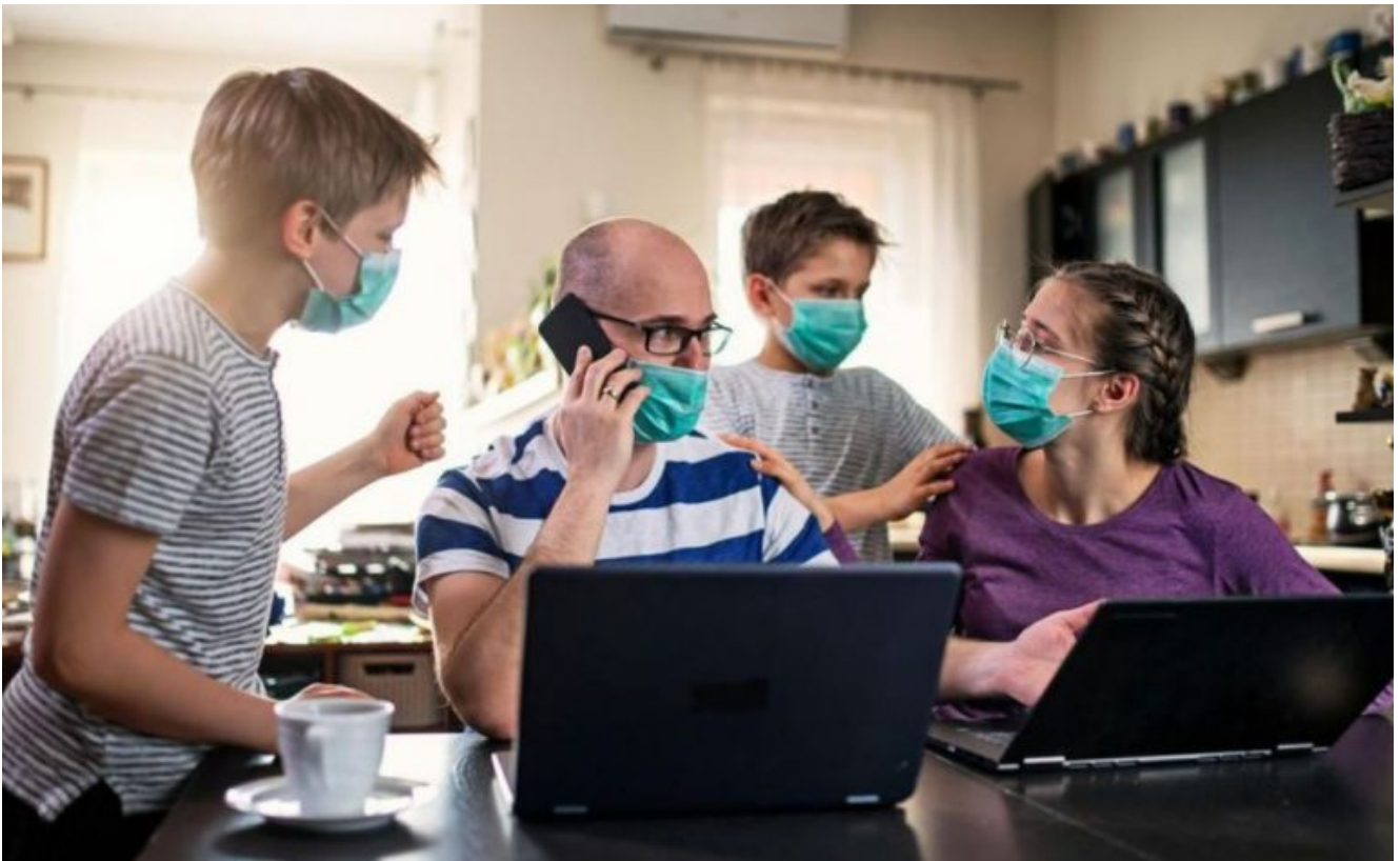
Illustration : Mélanie, coronaphobe anglaise, porte constamment un masque chez elle, même au lit « Ce soir, le sexe ne durera que cinq minutes. Joe sait qu'il doit porter un masque, des gants et doit se doucher avant et après avoir utilisé du savon ultra puissant et se tremper dans un désinfectant pour les mains avant même de pouvoir me toucher » (The Sun)

écrit par François des Groux | 17 novembre 2020