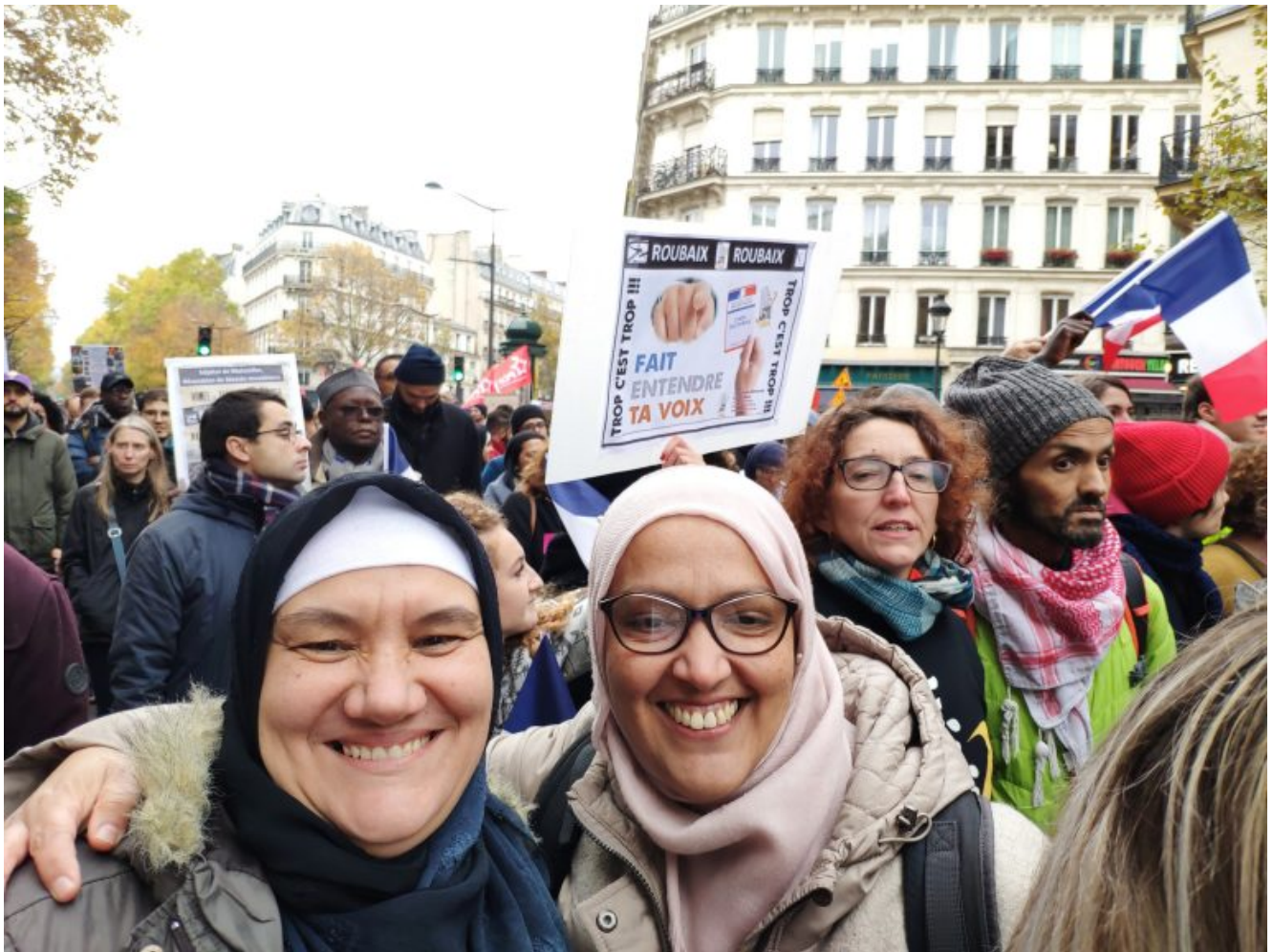
Illustration : gentille musulmane pratiquante ou méchante islamiste séparatiste ? Un dilemme existentiel pour un Emmanuel Macron et la gauche en amour avec l'islam...

écrit par François des Groux | 5 novembre 2020