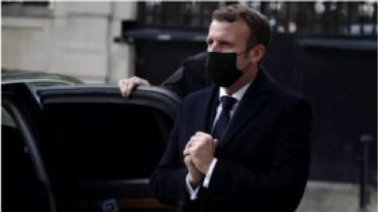
Le président Emmanuel Macron.

L'exercice de pédagogie continue. Après s'être expliqué à Al-Jazeera la semaine dernière, Emmanuel Macron a publié mercredi 4 novembre au soir dans le prestigieux quotidien britannique Financial Times une tribune pour expliquer que «la France se bat contre le séparatisme islamiste, jamais contre l'islam», en réponse à un article paru lundi mais retiré du site depuis.