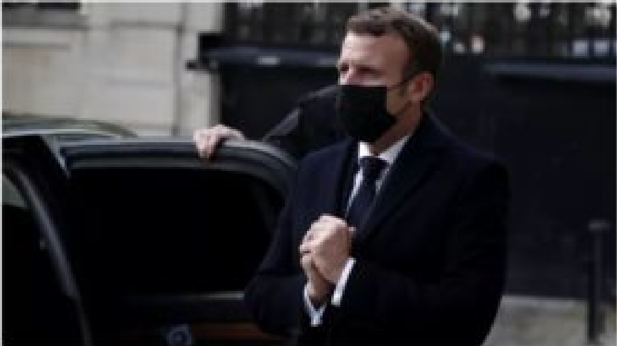
Le président Emmanuel Macron.

L'exercice de pédagogie continue. Après s'être expliqué à Al-Jazeera la semaine dernière, Emmanuel Macron a publié mercredi 4 novembre au soir dans le prestigieux quotidien britannique Financial Times une tribune pour expliquer que «la France se bat contre le séparatisme islamiste, jamais contre l'islam», en réponse à un article paru lundi mais retiré du site depuis.