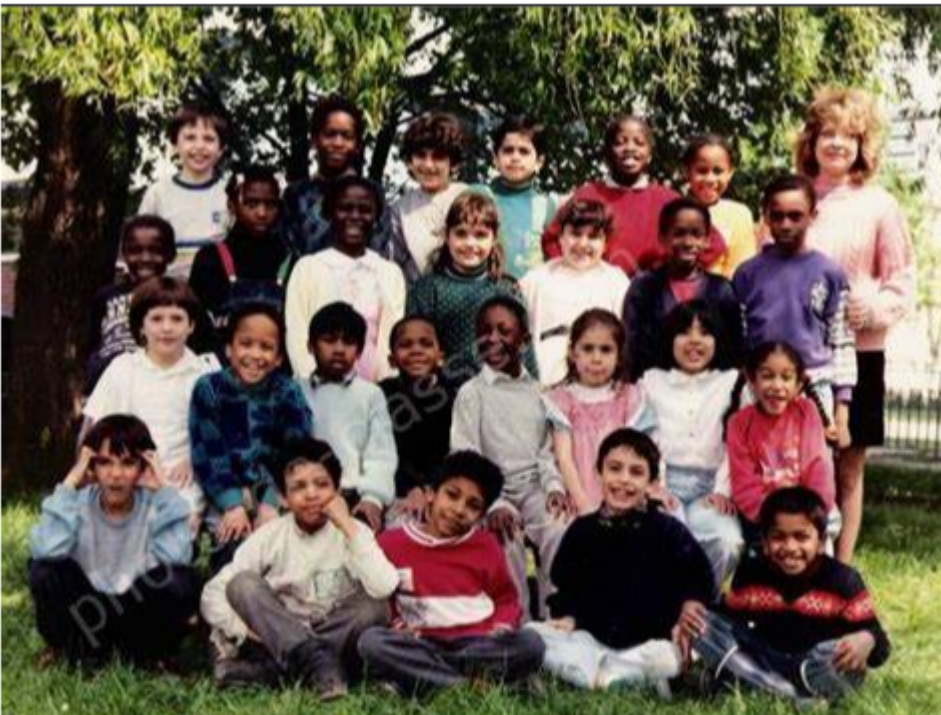
Photo classe CE1 à école Louis Pasteur 95200 Sarcelles France. Photo prise sur Google, donc entièrement publique, et dont aucun visage n'est flouté. Photo prise en 1988, donc maintenant...pire ou mieux ?

Il y a 40 ans, quand on passait le certificat d'étude ou le bac, ou tout autres examen, on passait le certificat d'étude, le bac, ou tout autre examen. Bon, c'était la normalité, le bon sens, c'là va sans dire mon ami patriote.