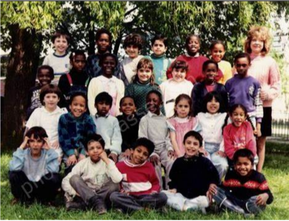
Photo classe CE1 à école Louis Pasteur 95200 Sarcelles France. Photo prise sur Google, donc entièrement publique, et dont aucun visage n'est flouté. Photo prise en 1988, donc maintenant...pire ou mieux ?

Toute personne faisant le moindre rapport entre le texte et l'iconographie de ce qui est écrit du début de cet article et cette image aurait l'esprit tordu et devrait courir chez le psychiatre le plus proche.