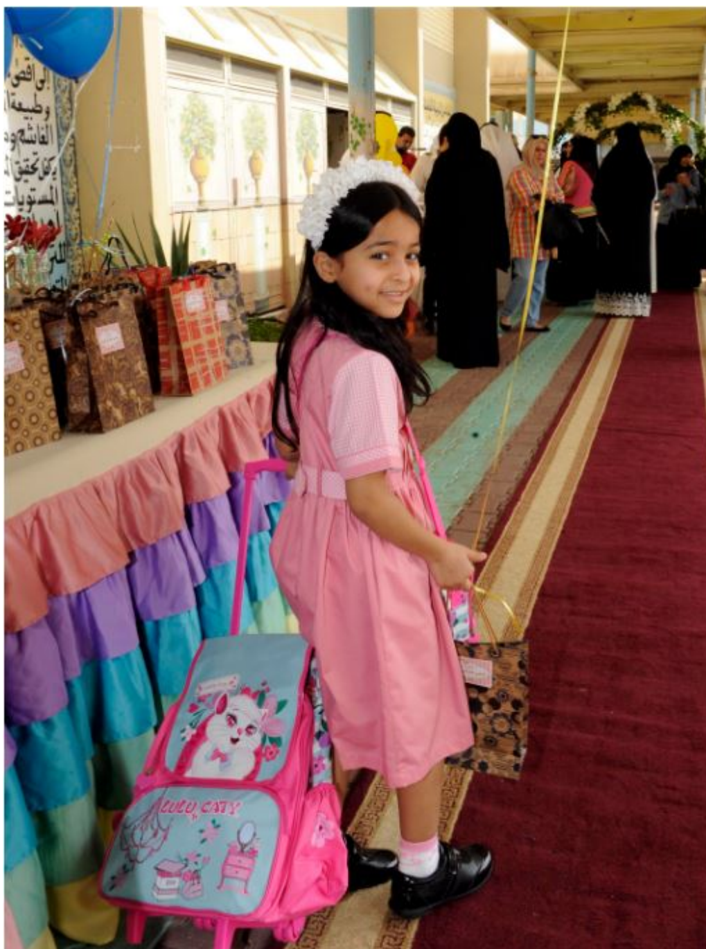
Maternelle (Kindergarten) au Koweït

Le parlement et le gouvernement koweïtiens ont approuvé une proposition visant à enseigner le Saint Coran dans les