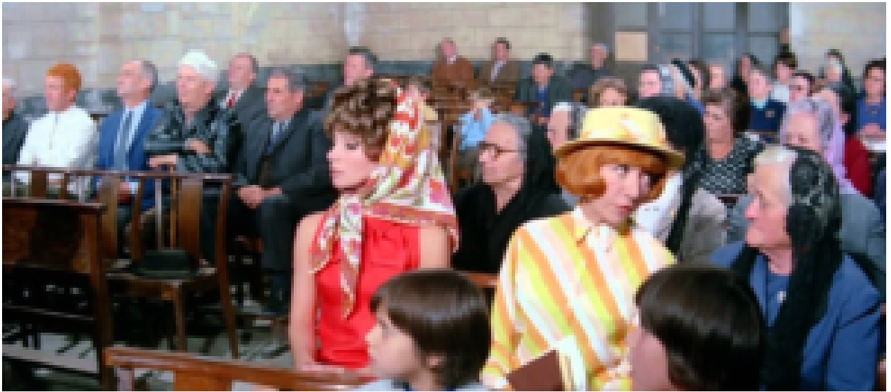
Le Petit Baigneur (1968) Messe à Notre-Dame des courants d'air