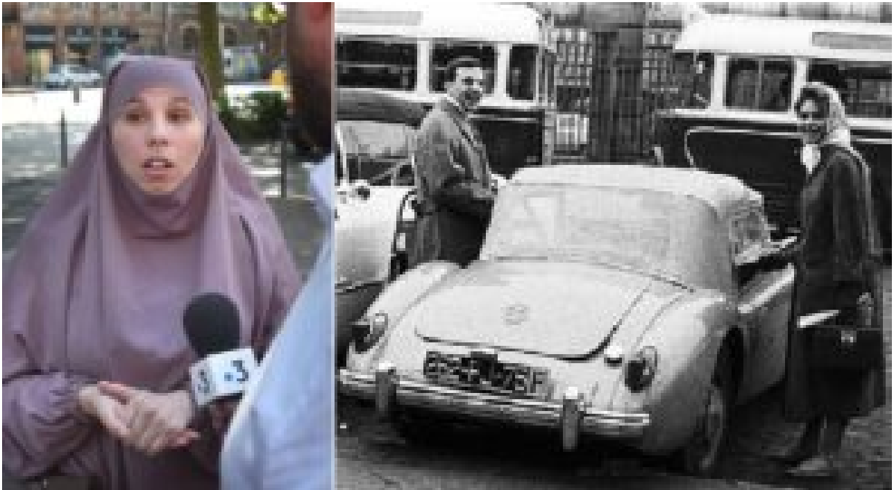
Illustration : une des plaignantes au procès de la buraliste « islamophobe » d'Albi. A droite : J-L Trintignant et Brigitte Bardot en fichu, dans les années 60

au foyer pour tomber dans celui bien pire de l'islam ?