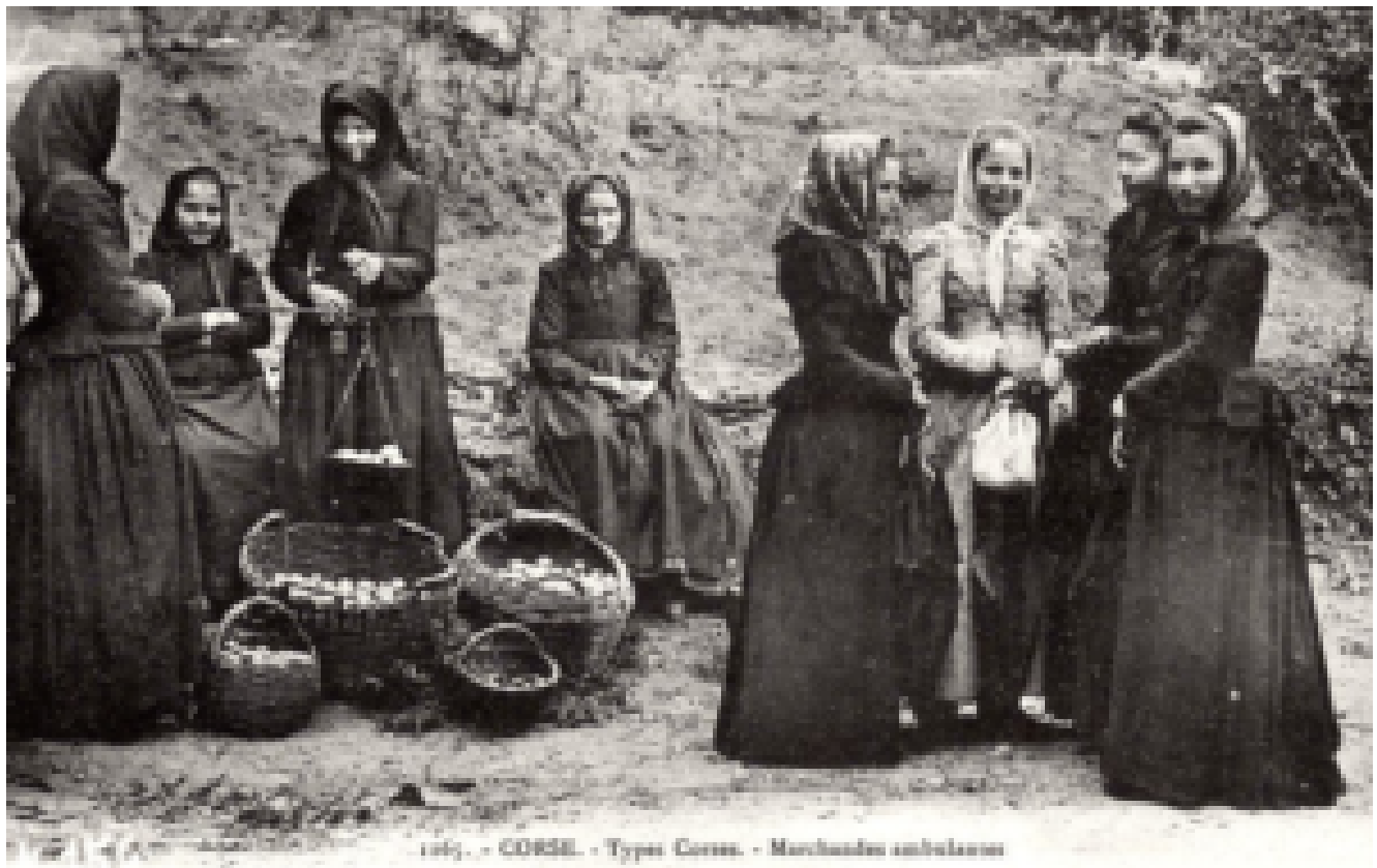
1874. - CORSE. - Types Corsas. - Marchandes ambulantes

Et surtout qui n'existaient pas non plus dans les pays du Maghreb comme le souligne bien le commentateur « Machinchose » et comme me l'ont confirmé mes proches qui étaient PN. Celui des plus fondamentalistes était blanc et cachait une partie du visage.