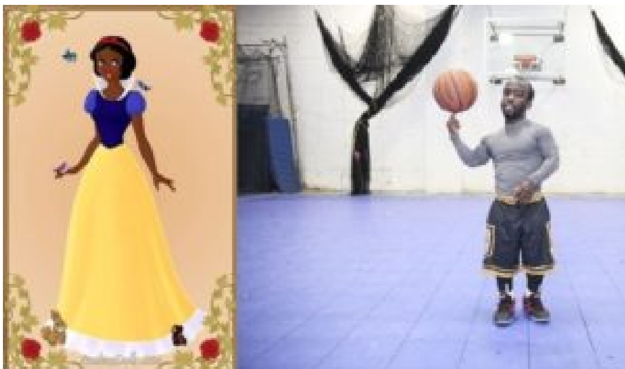
Noire-Charbon avec l'un des sept nains noirs