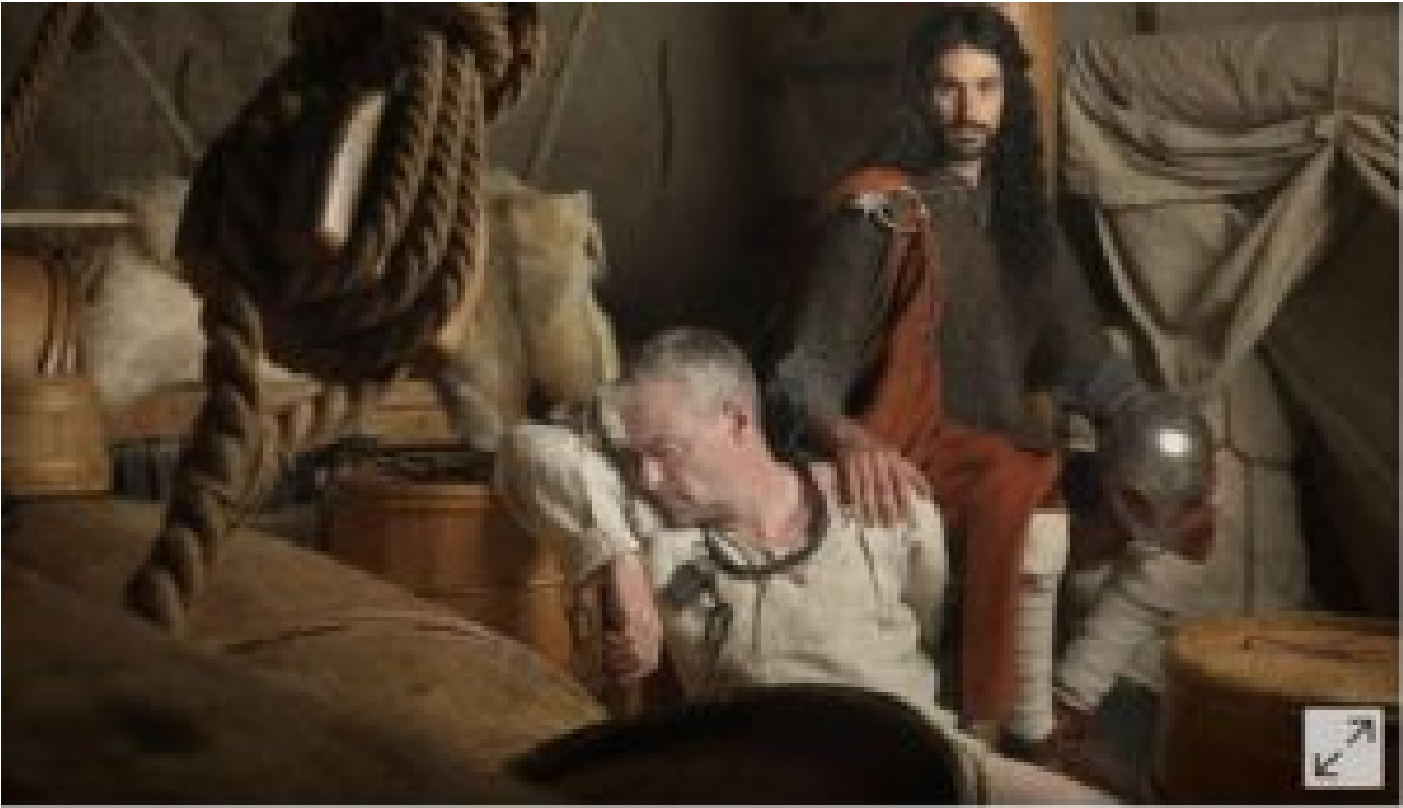
Une illustration de l'apparence probable de certains Vikings qui met en avant les flux génétiques étrangers observés. © Jim Lyngvild

Finis le blond viking, place au brun sicilien voire moyen-oriental... mélange de Jésus et de Mahomet