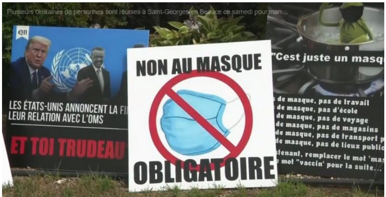
Photo : manifestante anti-masque au Québec

écrit par François des Groux | 11 août 2020