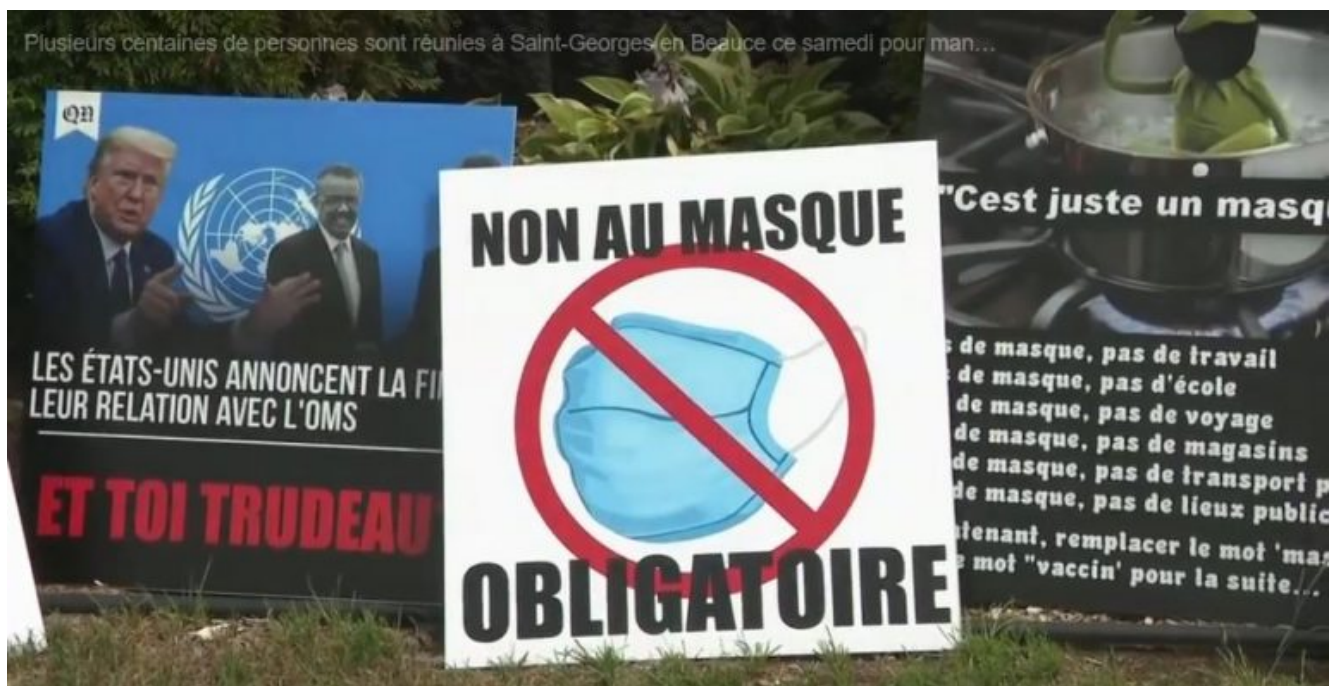
Photo : manifestante anti-masque au Québec ( Le Journal de Montréal )

écrit par François des Groux | 11 août 2020